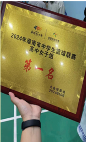
淮南市女子篮球联赛第一名