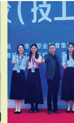
职业教育比赛文汇学子得奖