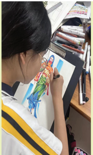
服装设计专业学生正在上课