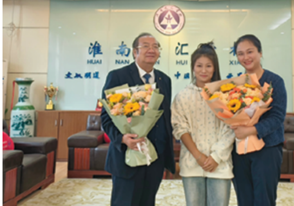
圆梦本科 感恩师校

新时代职业教育，重在固本培元、重在提质赋能、重在全面育人。淮南市文汇女子职业学校立足办学育人特点，贴合学生成长规律，创新构建孝道文化、课改文化、规范文化、健身文化四大核心育人文化体系。学校以文化立校、以特色兴校、以质量强校，坚持“德育、启智、正行、健体”多元办学理念，摒弃单一技能培养模式，实现品德修养、课堂质量、行为素养、身心健康全方位提升，让每一位文汇女职学子皆能修身立德、学有所长、向阳成长、绽放芳华。