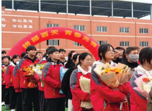
高考百日誓师大会