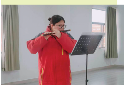
音乐专业课堂实拍