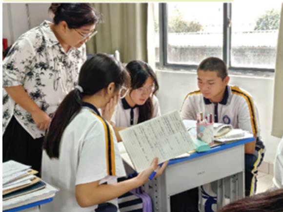
师生同心 研讨习题