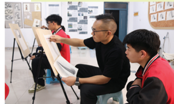
美术专业的老师正在教授知识