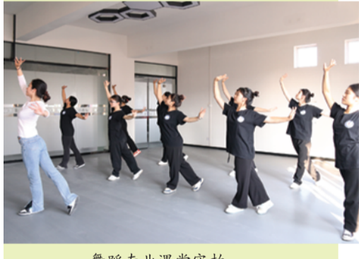
舞蹈专业课堂实拍