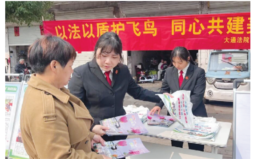
大通区法院干警走进进路店乡农贸市场，向群众普及鸟类保护法律知识。