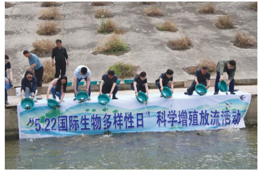
淮南中院联合凤台县法院开展科学增殖放流活动。

站在全新的历史起点，守护绿水青山，振兴淮河流域文明，使命光荣、责任重大。淮南法院将始终坚守司法初心，牢记使命，持续深耕环境资源审判主业，不断优化生态与文化协同保护机制，持续深化跨部门、跨区域协同治理，用心用情用力守护淮河生态屏障，传承千年流域文脉。全院将以法治为笔、以公正为墨，全力护航淮河生态经济带建设，助力淮河流域文明全面振兴，为加快建设中国式现代化美好淮南，书写人与自然和谐共生、优秀传统文化生生不息的精彩答卷，持续贡献坚实有力的淮南司法力量。