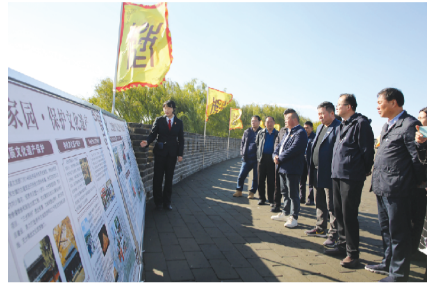
淮南中院邀请市人大代表、政协委员开展跨区视察活动。