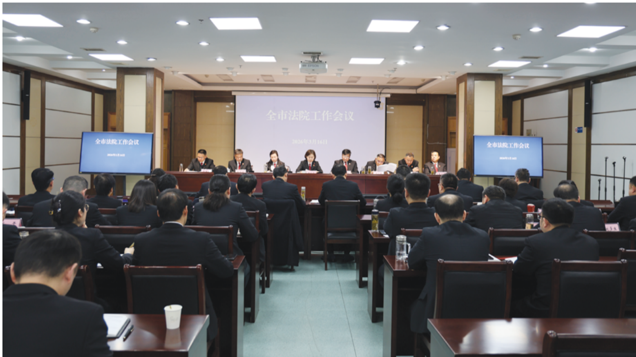
2026年度全市法院工作会议。

富，人文遗迹是流域文明代代延续的鲜活载体。依托淮南楚汉文化资源富集、淮河生态资源多样的地域特色，结合淮河流域文明振兴整体规划布局，淮南法院打破“就案办案”的传统思维，与时俱进丰富环境资源司法保护的内涵与边界，积极探索“自然资源+文化遗产”协同保护新模式，将人文遗迹全面纳入生态司法保护范畴，推动自然生态与历史文化实现一体规划、一体保护、一体发展。