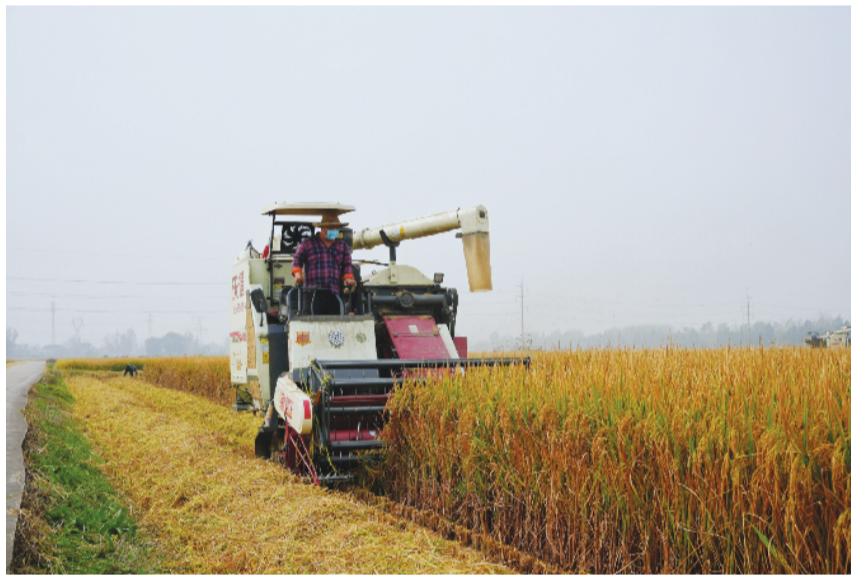
图为高标准农田建设助力我市粮食连年丰收。

“主干渠像大动脉,支渠像毛细血管,清澈的水流欢快地奔跑着,想往哪儿流就往哪儿流,想什么时候放水就什么时候放。俺们以后再也不用为农