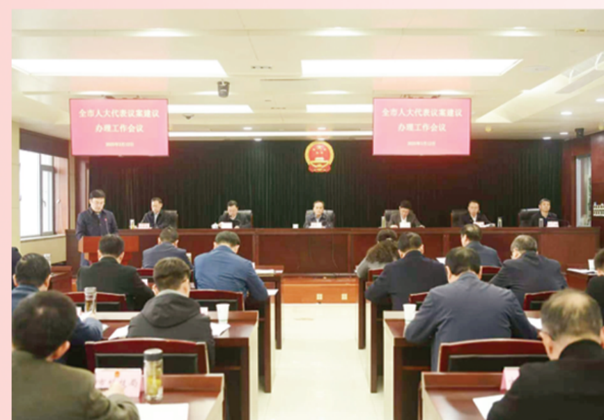
全市人大代表议案建议办理工作会议召开