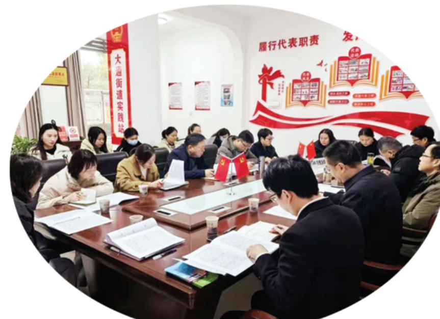
市人大常委会推进全过程人民民主实践站建设