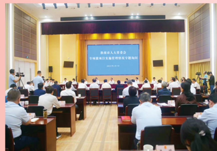
市人大常委会开展专项项目实施管理情况专题询问

一年来，坚持代表主体地位，深入开展“关注民生提建议、五级代表在行动”，市委《民声呼应》共采纳代表建议19条。