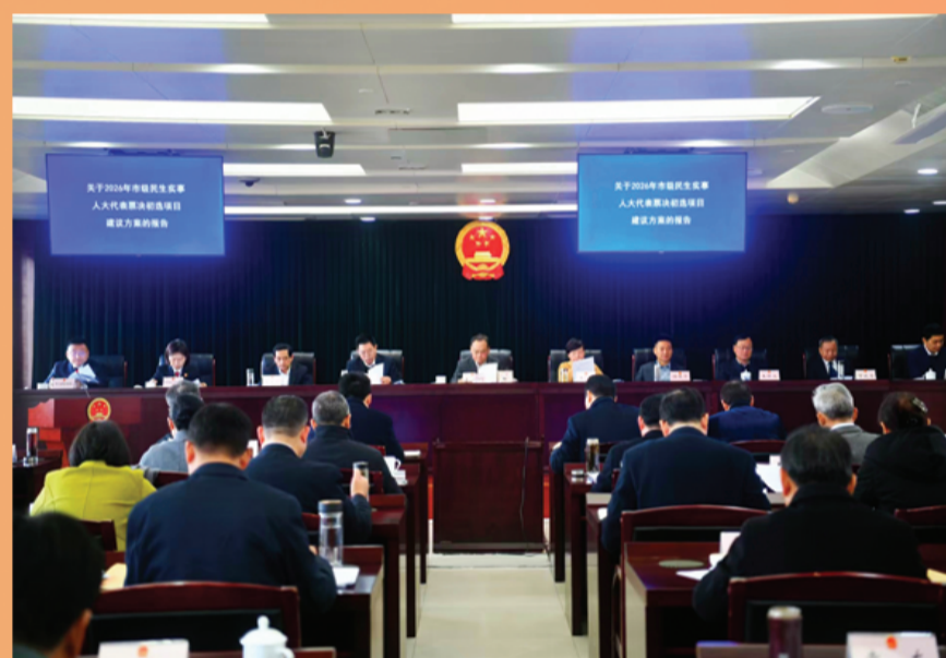
市人大常委会听取2026年市本级民生实事人大代表票决初选项目建议方案的报告