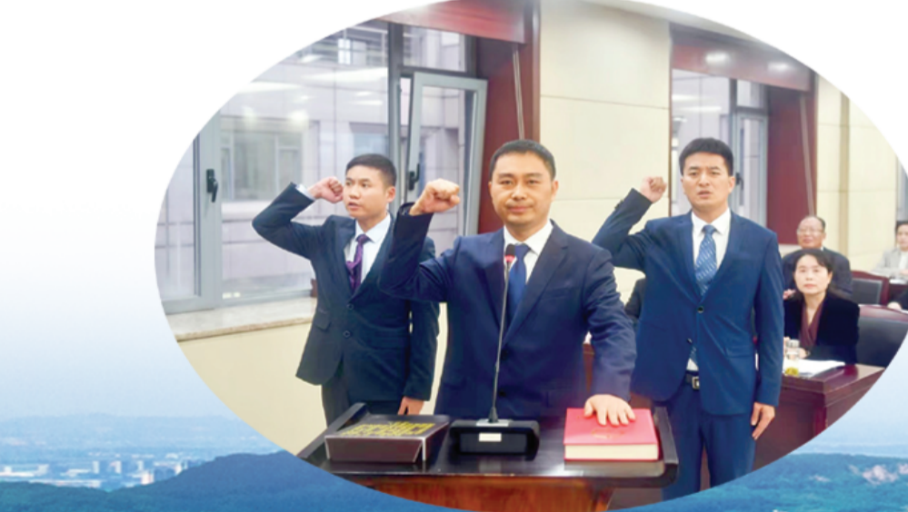
市人大常委会组织新任人员进行宪法宣誓