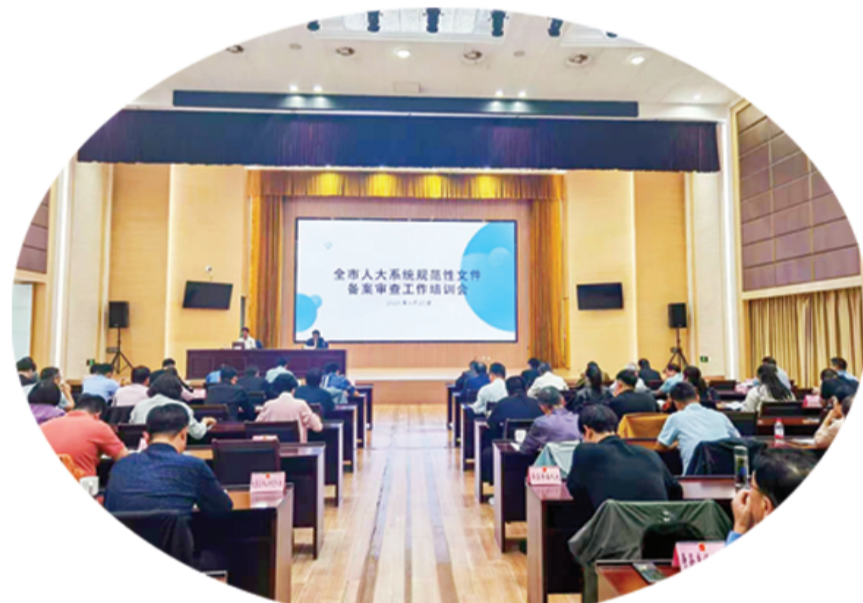
全市人大系统规范性文件备案审查工作培训会召开

继往开来，薪火相传。2026年是“十五五”规划开局之年。市人大常委会将在市委的坚强领导下，坚持以习近平新时代中国特色社会主义思想为指导，认真贯彻落实党的二十大和二十届历次全会精神，深入学习贯彻习近平法治思想、习近平总书记关于坚持和完善人民代表大会制度的重要思想以及考察安徽重要讲话精神，依法行使宪法法律赋予的各项职责，在科学立法上展现新作为，在强化监督上实现新突破，在发挥代表作用上力求新进展，不断发展新阶段全过程人民民主，推动人大工作高质量发展，为实现我市“十五五”开好局、起好步贡献人大力量。