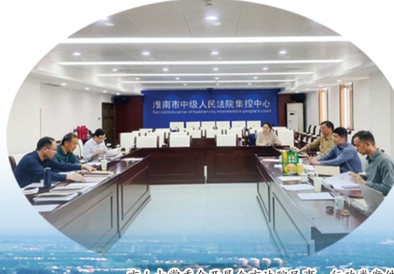
市人大常委会开展全市法院民事、行政类案件质量评查