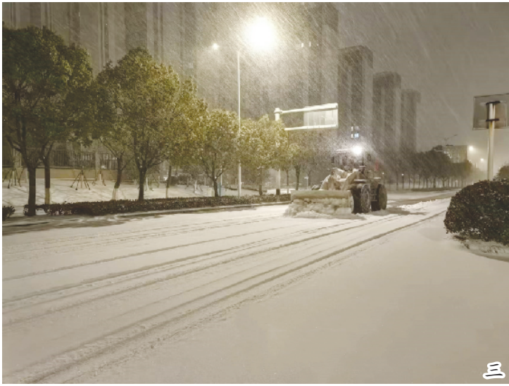
图一、田家庵区人武部以雪为令,集结民兵队伍100余人,携带除雪工具,迅速投入广场北路扫雪除冰作业。为便利市民出行,人武部还组织官兵来到居民社区附近道路交通要口铲除冰雪、清积水,为市民出行提供安全保障。