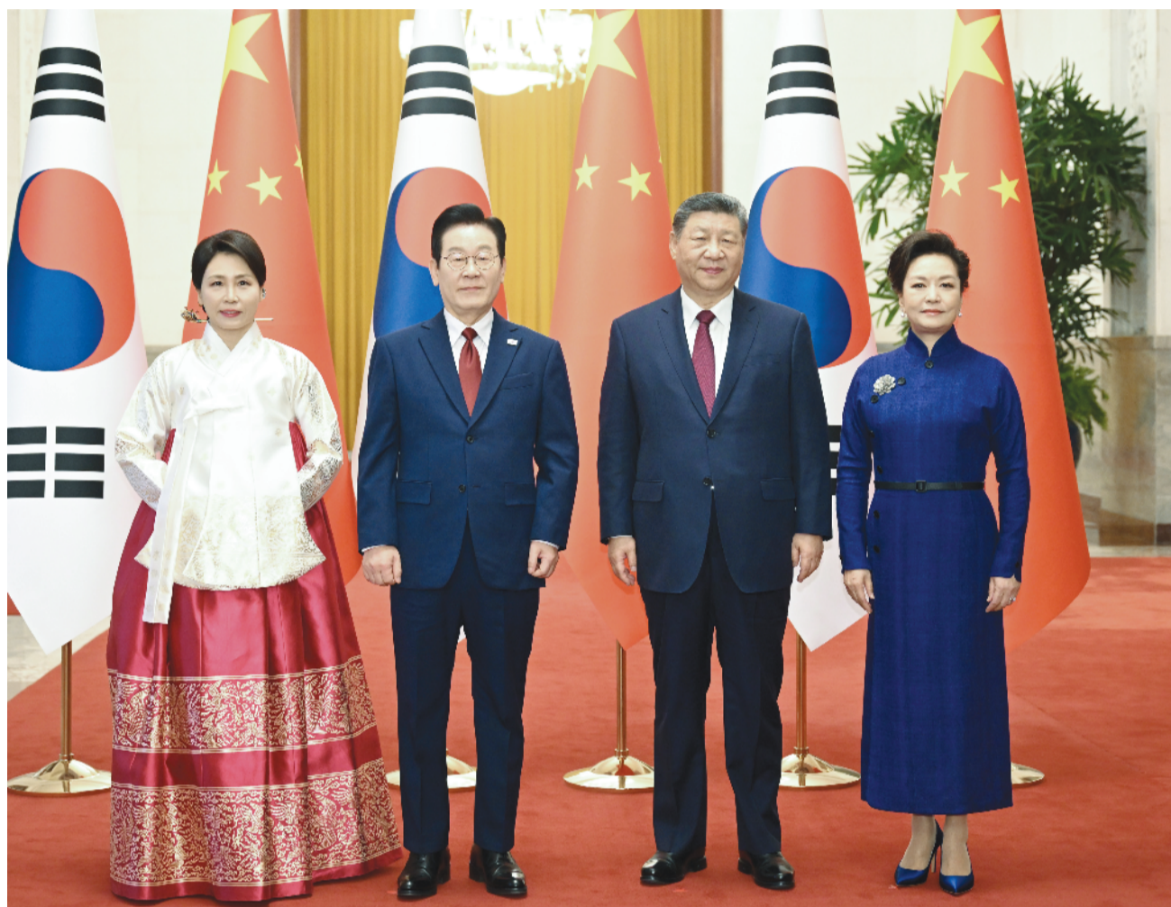
1月5日下午，国家主席习近平在北京人民大会堂同来华进行国事访问的韩国总统李在明举行会谈。这是会谈前，习近平和夫人彭丽媛同李在明和夫人金惠恩合影。