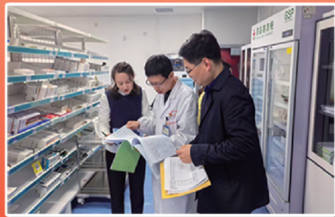
关注全市公立医疗机构药品集中带量采购情况