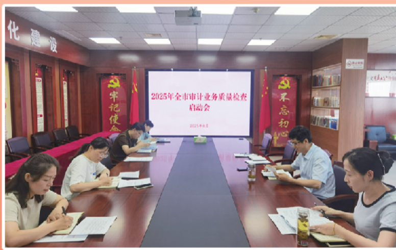
开展全市审计业务质量检查