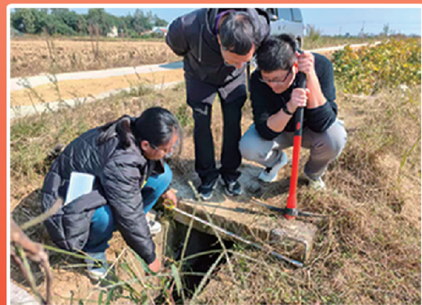
跟踪审计全市高标准农田建设情况