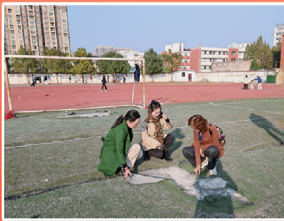
关注全市中小校园建设情况