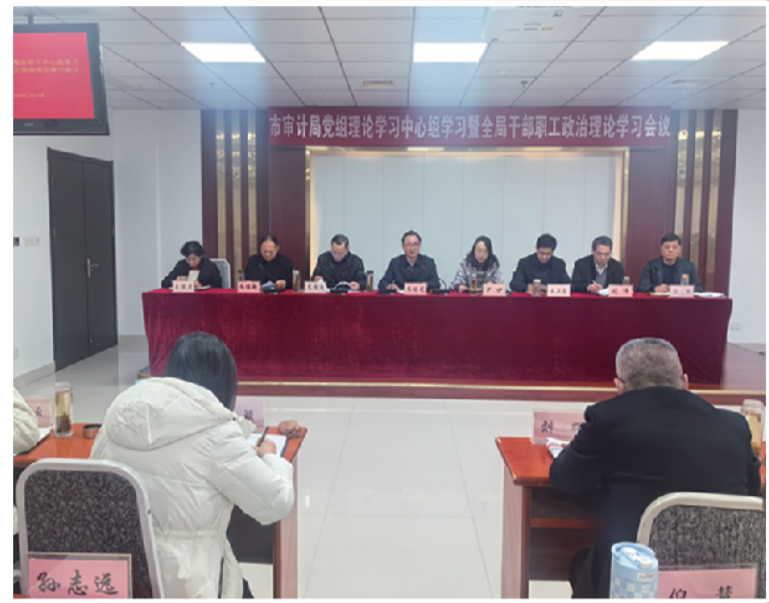
开展审计干部政治理论学习会议

新时代赋予新使命，新征程呼唤新作为。淮南审计将继续以科学的理念、规范的理念、规范的理念、规范的理念，奋力书写以高质量审计监督服务淮南高质量发展的崭新篇章，为加快建设现代化美好淮南贡献更大的审计智慧和力量！