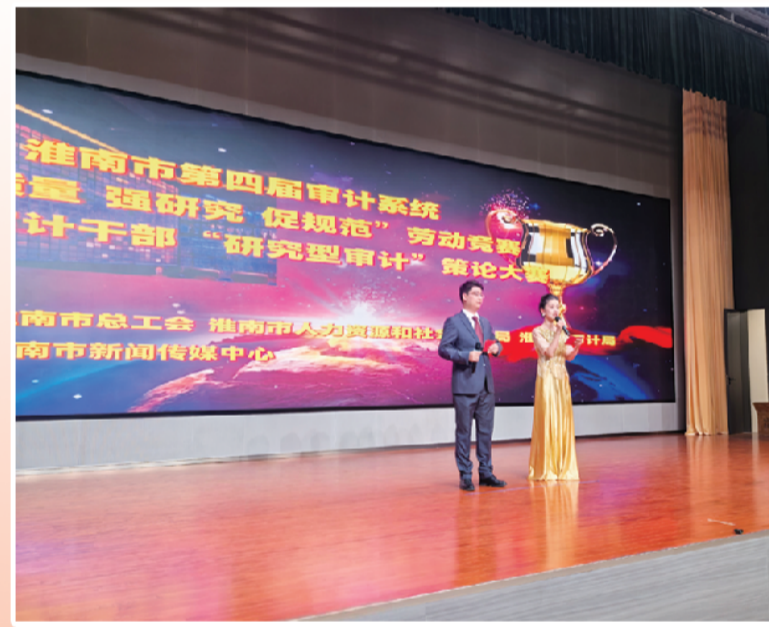
举办淮南市第四届审计系统“提质量 强研究 促规范”劳动竞赛暨青年审计干部“研究型审计”策论大赛