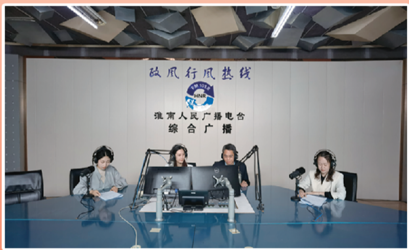
参加淮南市广播电视台“政风行风”栏目