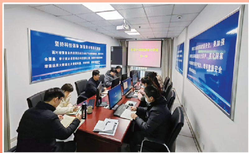
开设“数据审计讲堂”培训