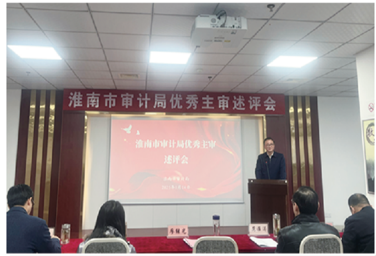
开展优秀审计主审述评会