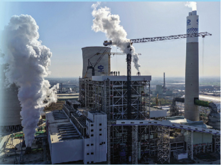
建设中的滁州发电项目