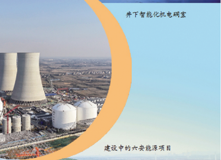
建设中的六安能源项目