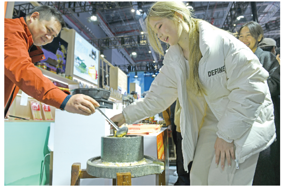
观众在安徽八公山豆制品制品有限公司展位体验传统豆腐制作技艺。