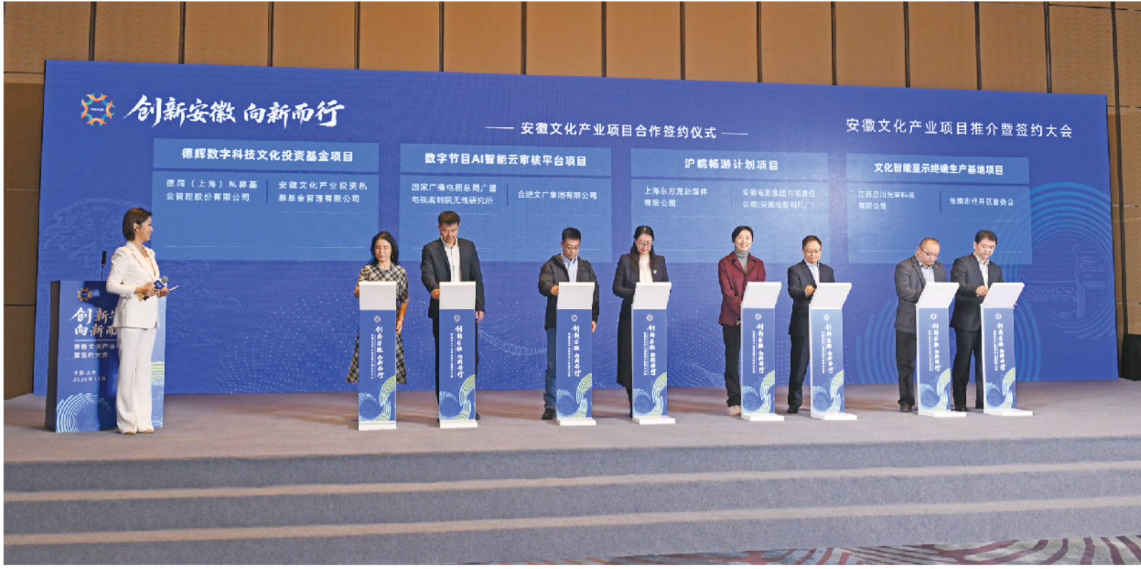
安徽文化产业项目推介暨签约仪式现场，总投资1.45亿元的文化智能显示终端生产基地项目成功签约。