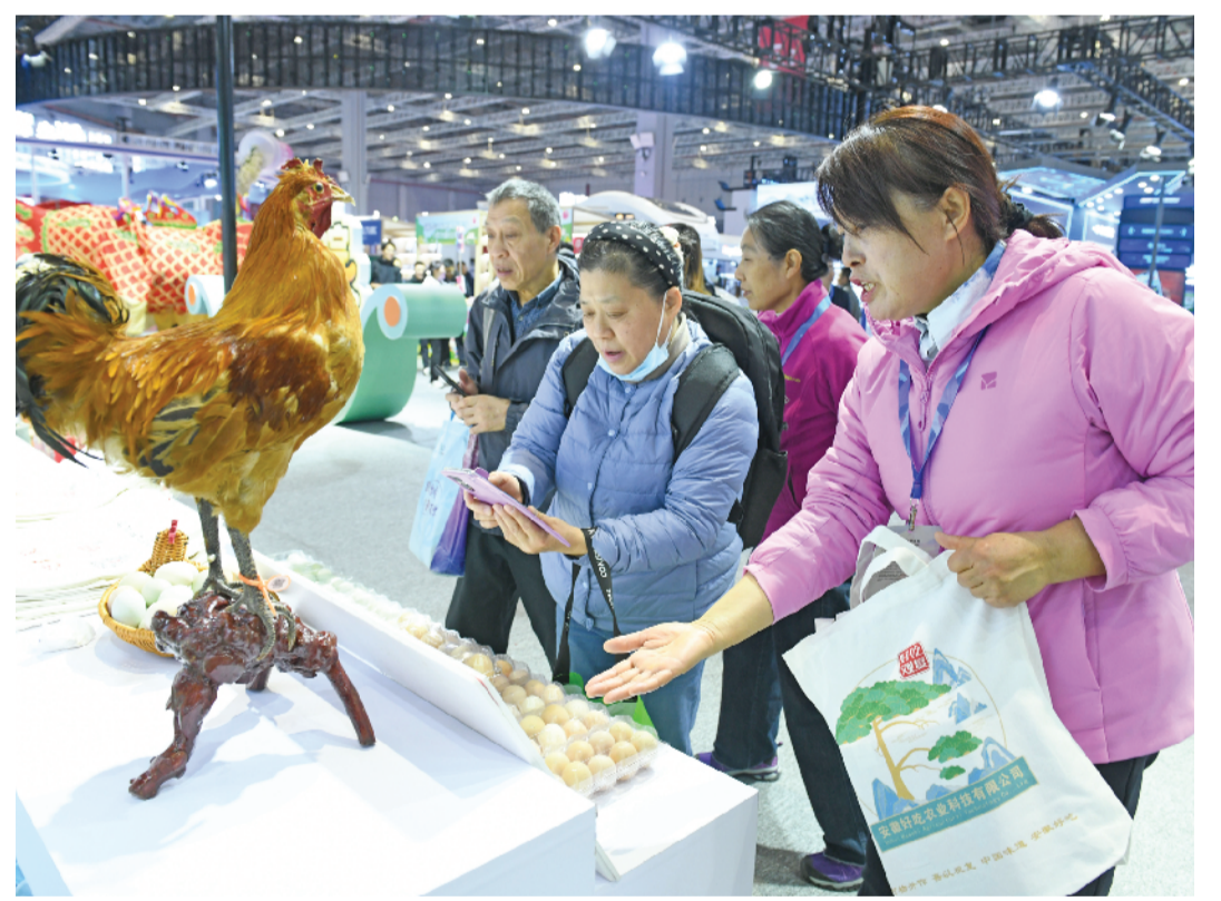
安徽好吃农业科技有限公司现场烹制淮南牛肉汤、麻黄鸡汤等特色美食免费供观众品尝。