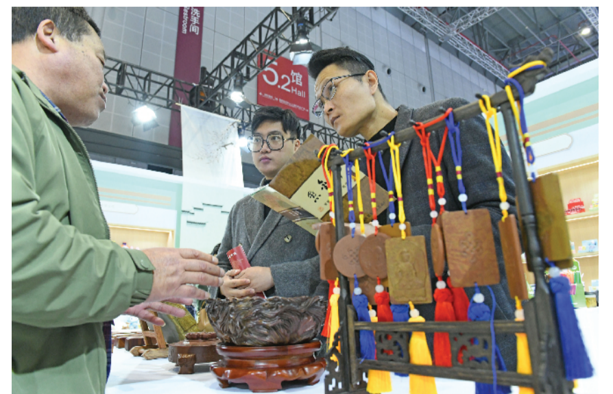
淮南市金陵文苑紫金石工艺品厂加工的紫金砚产品引人关注。