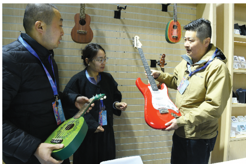
淮南乐森黑马乐器有限公司生产的电吉他等乐器出口海外市场。