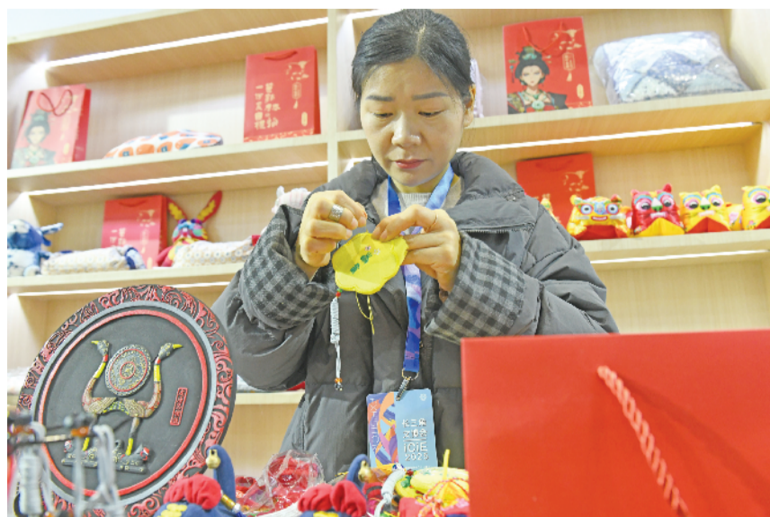
安徽鸿康旅游集团有限公司展示寿州香草等文创产品。