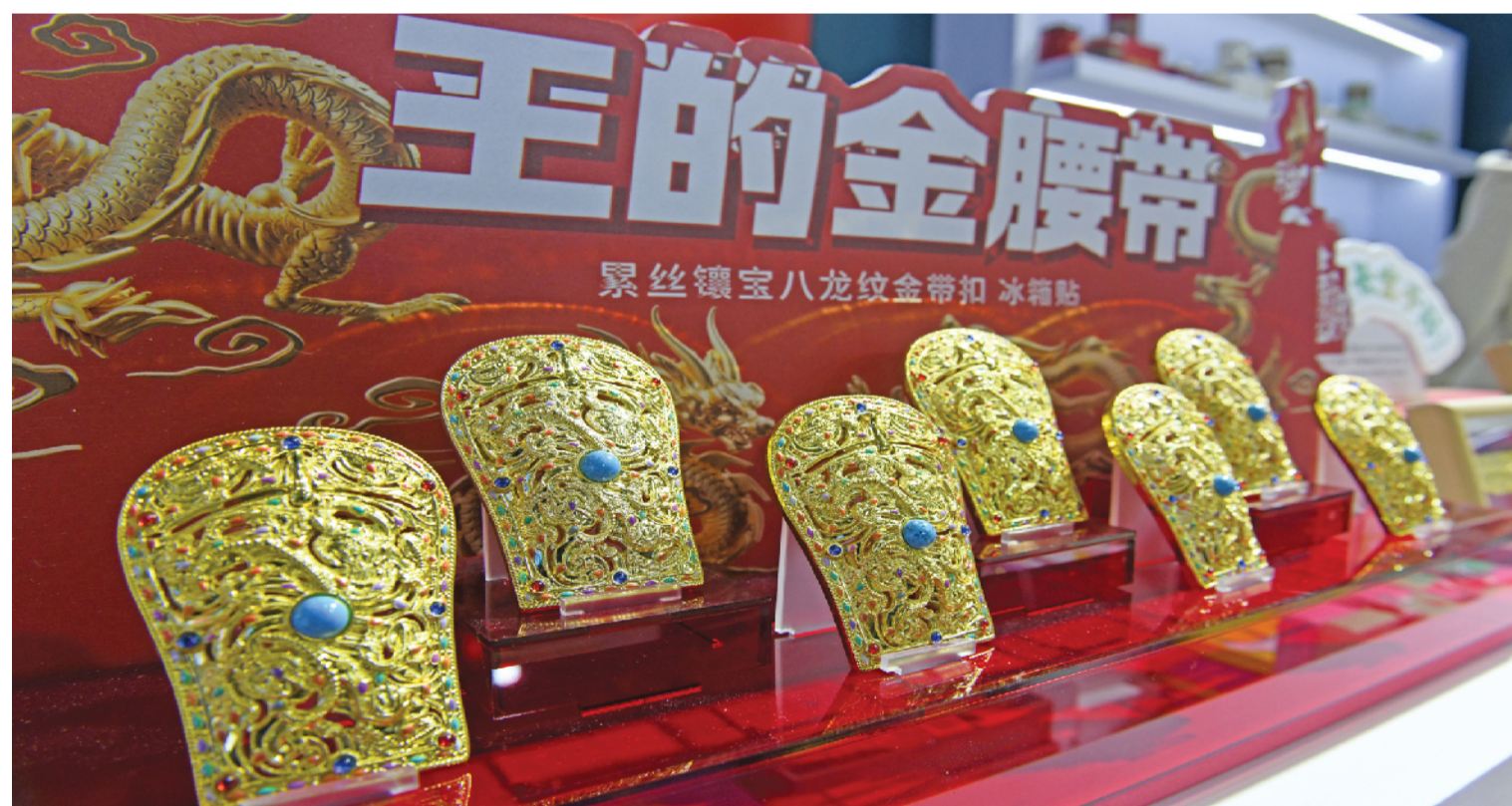
安徽谷语文化产业有限公司展出“王的金腰带”冰箱贴成为展会中爆款产品。