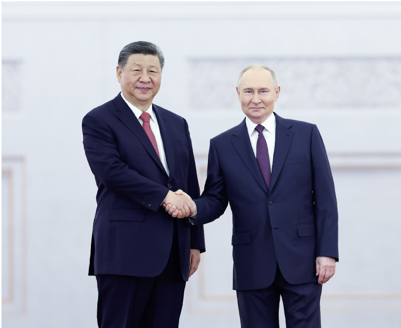
当地时间 5 月 8 日上午,俄罗斯总统普京同中国国家主席习近平在莫斯科克里姆林宫举行会谈。普京在乔治大厅为习近平举行隆重欢迎仪式。这是两国元首亲切握手合影。

新华社莫斯科 5 月 8 日电 (记者倪四义 胡晓光)当地时间 5 月 8 日上午,俄罗斯总统普京同中国国家主席习近平在莫斯科克里姆林宫举行会谈。两国元首就中俄关系和重大国际和地区问题深入交换意见,一致同意坚定不移深化战略协作,推动中俄关系稳定、健康、高水平发展;共同弘扬正确二战史观,维护联合国权威和地位,维护国际公平正义。