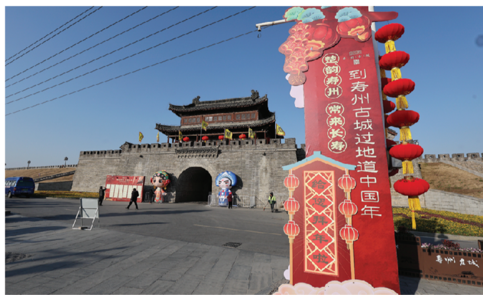
定湖门（西门）红红火火