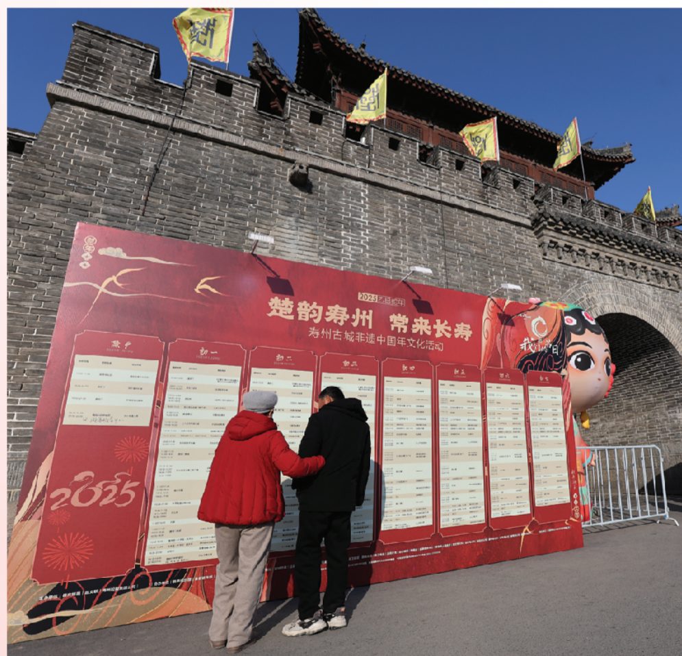
丰富多彩的节目供游客选择