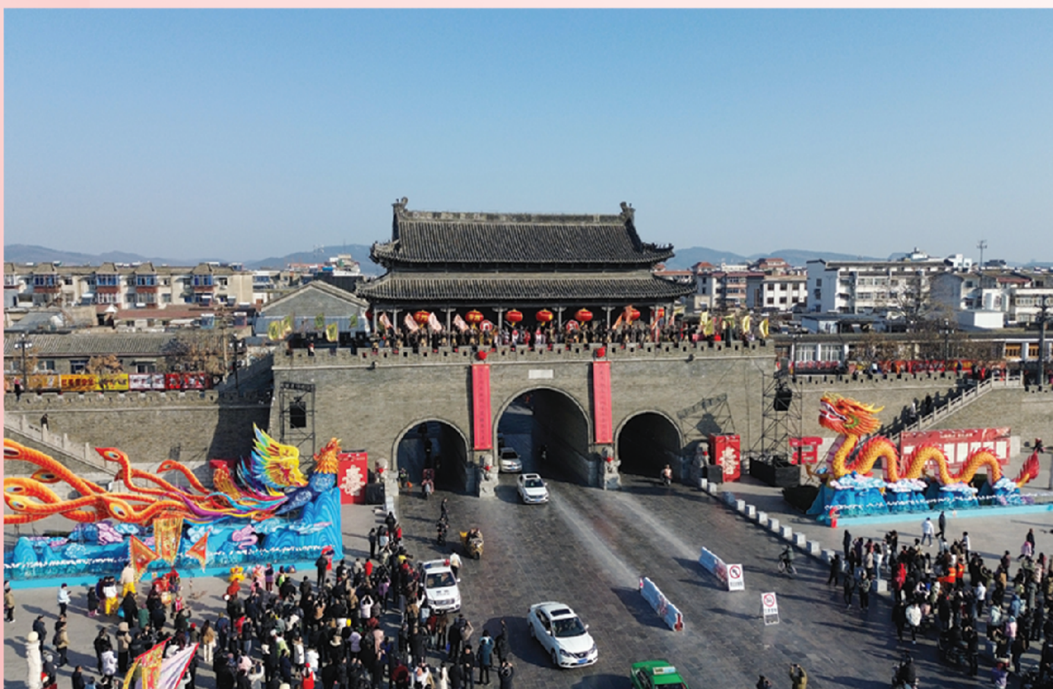
通淝门（南门）外龙凤呈祥