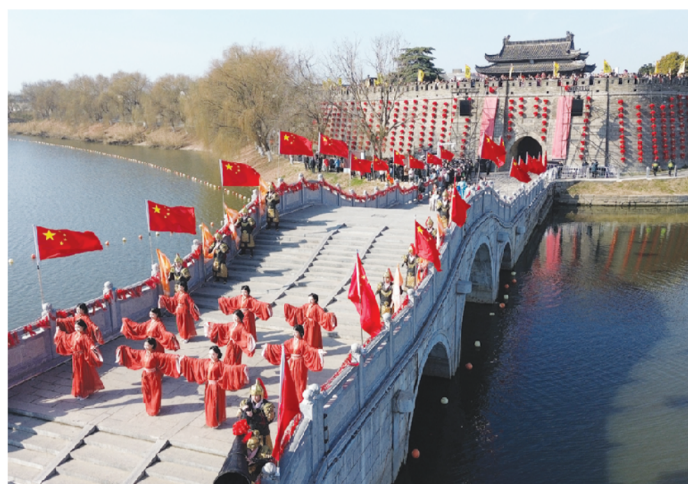
宾阳门（东门）迎宾礼