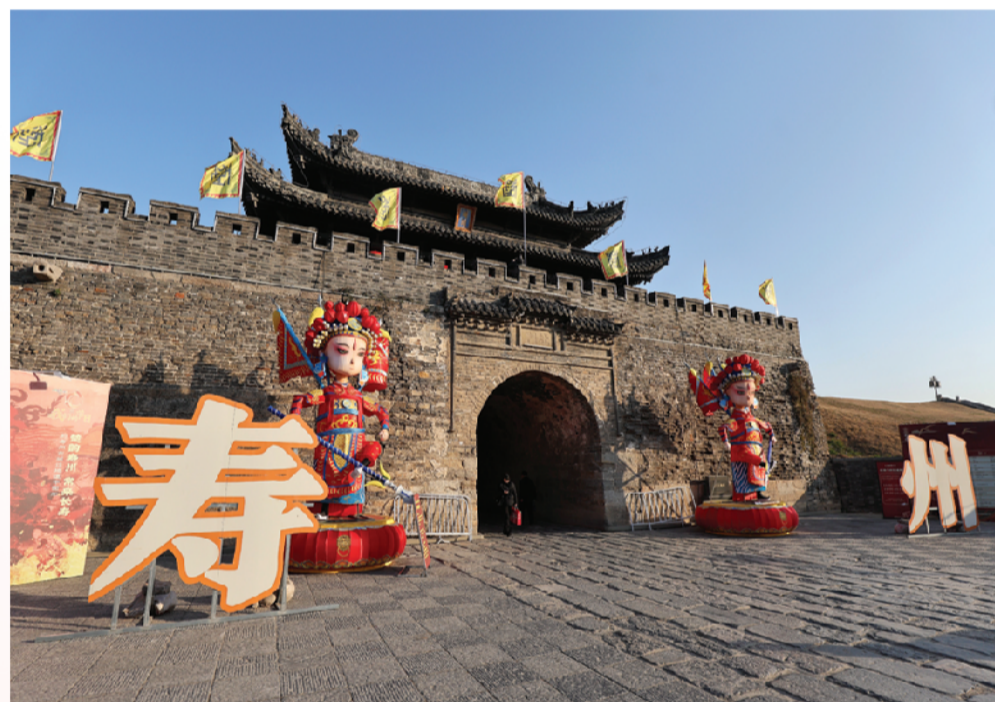
靖淮门（北门）精致古朴