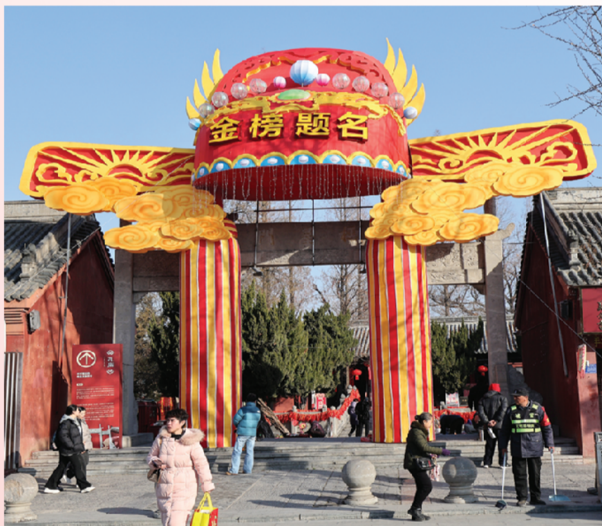
西大街魁星阁旁“金榜题名”