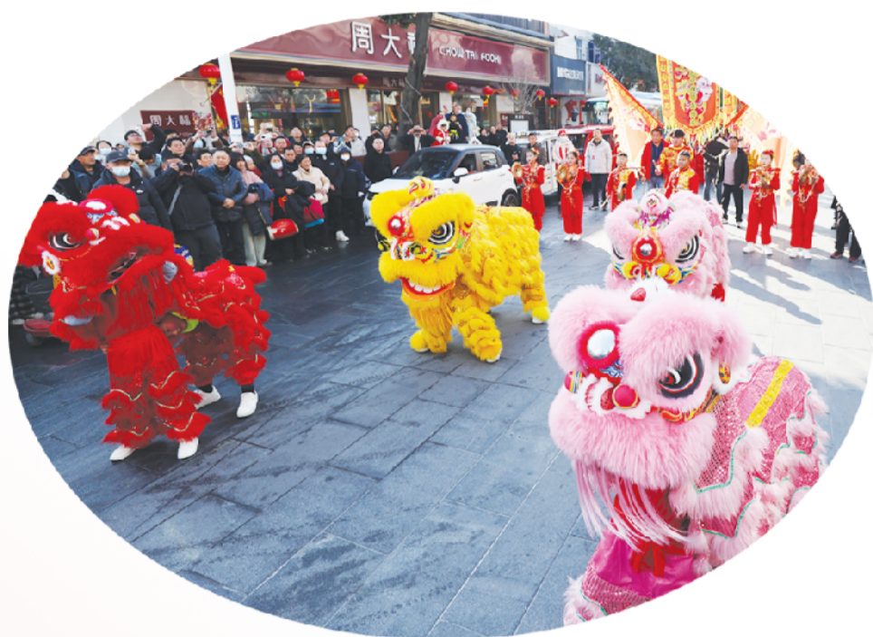
瓦埠镇的小学生组成的龙狮、锣鼓队