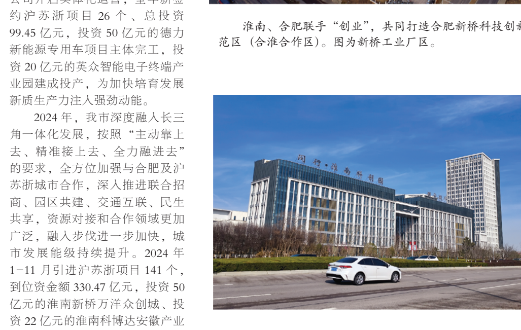
闵行·淮南科创园已吸引多家企业入驻。

2024年，淮南、合肥联手“创业”，共同打造合肥新桥科技创新示范区（合淮合作区），被国家发展改革委纳入全国现代化都市圈培育案例。合淮合作区成立以来，寿县新桥片区吸引了52家汽车零部件企业，签约总投资212.96亿元，总投资51.6亿元、年产160万台套的蔚来电驱动二期项目主体结构封顶，总投资110亿元的蔚来F3工厂项目开工建设。闵行淮南科创产业园合资公司开启实体化运营，全年新签约沪苏浙项目26个、总投资99.45亿元，投资50亿元的德力新能源专用车项目主体完工，投资20亿元的英众智能电子终端产业园建成投产，为加快培育发展新质生产力注入强劲动能。 2024年，我市深度融入长三角一体化发展，按照“主动靠上去、精准接上去、全力跟进去”的要求，全方位加强与合肥及沪浙城市合作，深入推进联合招商、园区共建、交通互联、民生共享，资源对接和合作领域更加广泛，融入步伐进一步加快，城市发展能级持续提升。2024年1-11月引进沪苏浙项目141个，到位金额330.47亿元，投资50亿元的淮南新桥方洋众创城、投资22亿元的淮南科博达装备制造基地等项目加速推进。“淮南—上海”铁海联运班列开通，淮南铁海联运平台正式迈入双通道运行。