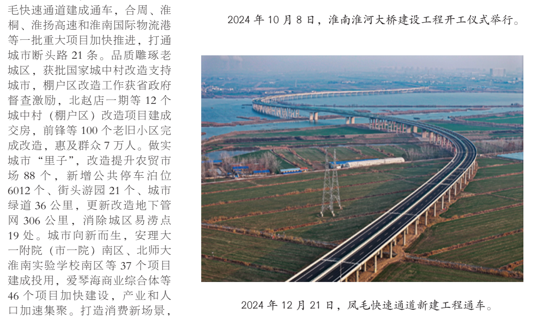
2024年12月21日，凤马快速通道新建工程通车。

2024年10月8日，淮南淮河大桥开工建设，标志着淮南市跨河发展迈出了历史性的一步。2024年12月21日，凤马快速通道新建工程通车，有效改善凤台和毛集镇的出行条件。城市交通从“串”到“畅”，以交通升级赋能城市品质提升。 2024年，我市以实施城市更新攻坚行动为抓手，推动城市建设由“粗放生长”向“精耕细作”转变。畅通“大动脉”，打造“微循环”，十洲湖东路改造工程开工建设，中兴路下穿、凤马快速通道建成通车，合淮、淮南、淮杨高速和淮南国际物流港等一批重大项目加快推进，打通城市断头路21条。品质雕琢老城区，获批国家城中村改造支持城市、棚户区改造工作获省政府督查激励，北赵店一期等12个城中村（棚户区）改造项目建成交房，前鋒等100个老旧小区完成改造，惠及群众7万人。做实城市“里子”，改造提升农贸市场88个，新增公共停车位6012个、街头游园21个。城市绿道36公里，消除城区易涝点19处。城市向新而生，安理大淮南实验学校南区等37个项目建成投用，爱琴海商业综合体等46个项目加快建设，产业和人口加速集聚。打造消费新场景，春申里商业街等“火爆”开业，新引进首店30余家，新认定安徽老字号企业11家。