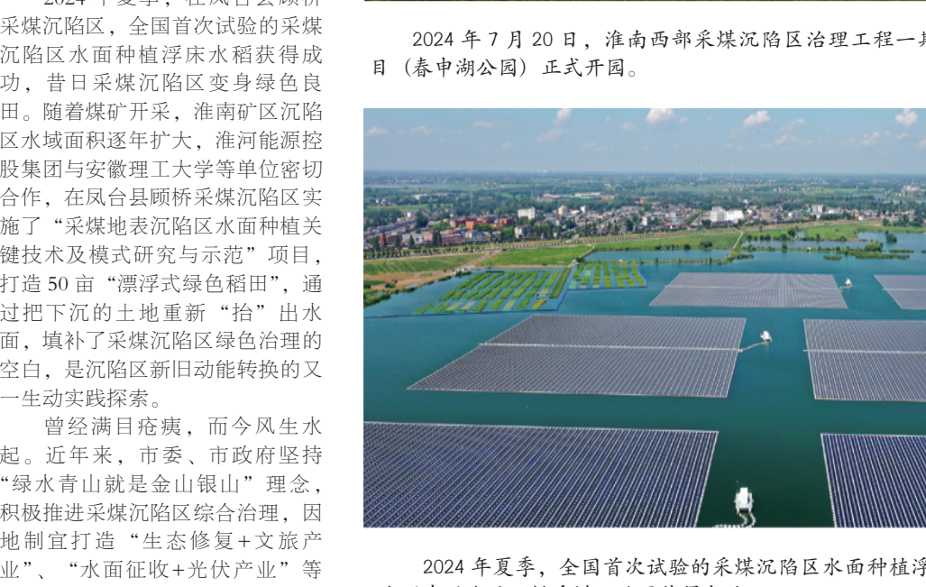
2024年夏季，全国首次试验的采煤沉陷区水面种植浮床水稻在凤台县颍桥采煤沉陷区获得成功。

2024年7月20日，西部采煤沉陷区治理工程一期项目（春申湖公园）正式开园，昔日采煤沉陷区变身美丽城市公园。春申湖公园占地约10745亩，原为淮南矿业集团采煤沉陷区，我市积极探索采煤沉陷区生态修复和可持续发展模式，在项目建设中遵循“因地制宜、最小干预”的理念，通过生态系统提升、城市风貌转变、交通网络完善、生态导向开发和文旅产业导入，实现了采煤沉陷区的“华丽蝶变”。 2024年夏季，在凤台县颍桥采煤沉陷区，全国首次试验的采煤沉陷区水面种植浮床水稻获得成功，昔日采煤沉陷区变身绿色良田。随着煤矿开采，淮南矿区沉陷区水域面积逐年扩大，淮河能源控股集团与安徽理工大学等单位密切合作，在凤台县颍桥采煤沉陷区实施了“水面地表沉陷区水面种植关键技术及模式研究与示范”项目，通过50亩“漂浮式绿色稻田”，把下沉的土地重新“抬”出水面，填补了采煤沉陷区绿色治理的空白，是沉陷区新旧动能转换的又一生动实践探索。 曾经满目疮痍，而今风生水起。近年来，市委、市政府坚持“绿水青山就是金山银山”理念，积极推进采煤沉陷区综合治理，因地制宜打造“生态修复+文旅产业”、“水面征收+光伏产业”等治理模式，探索出了具有淮南特色的转型发展之路。