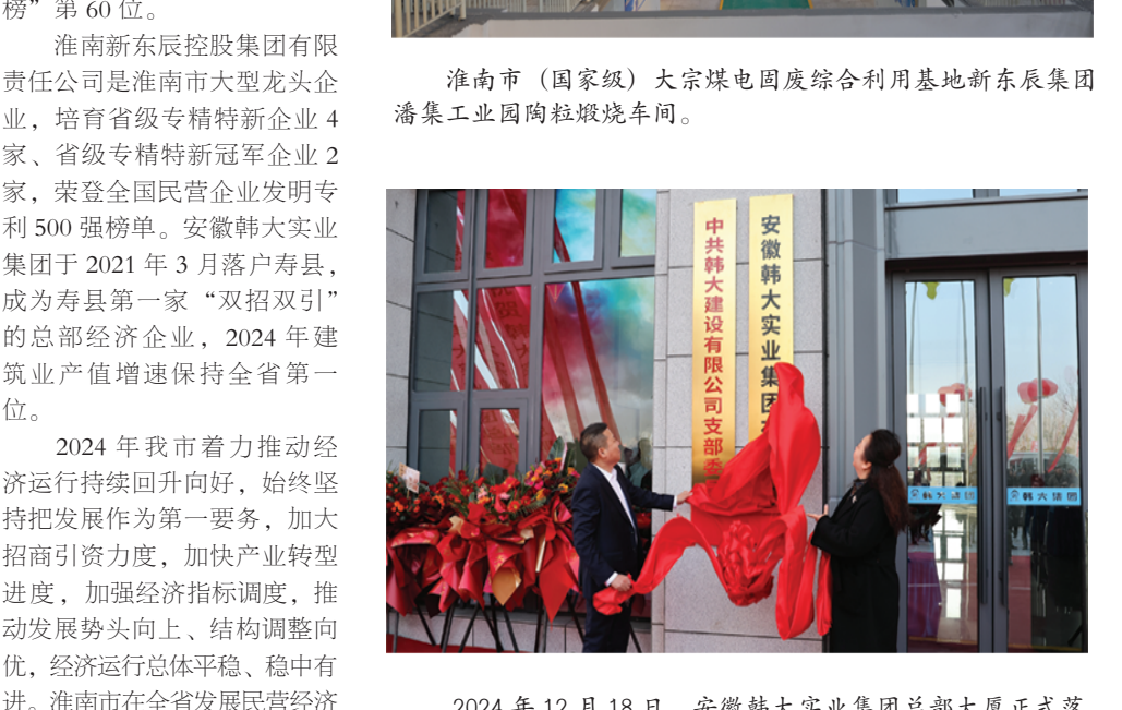
2024年12月18日，安徽韩大实业集团总部大厦正式落成入驻寿县。

2024年11月29日，安徽省民营企业营收百强、制造业百强、服务业百强榜单出炉，淮南新东辰控股集团有限责任公司全年实现收入90亿元，入选2024安徽省制造业百强企业，荣登“2024安徽省民营企业营收百强榜”第78位，“2024安徽省民营企业服务业百强榜”第22位，安徽韩大实业集团荣登“2024安徽省民营企业服务业百强榜”第60位。 淮南新东辰控股集团有限责任公司是淮南市大型龙头企业，培育省级专精特新企业4家，省级专精特新冠军企业2家，荣登全国民营企业发明专利500强榜单。安徽韩大实业集团于2021年3月落户寿县，成为寿县第一家“双招双引”的总部经济企业，2024年建筑业产值增速保持全省第一位。 2024年我市着力推动经济运行持续回升向好，始终坚持把发展作为第一要务，加大招商引资力度，加快产业转型升级，加强经济指标调度，推动发展势头向上、结构调整向优，经济运行总体平稳、稳中有进。淮南市在全省发展民营经济工作考核中位居第10位，为历年以来市取得的最好成绩。