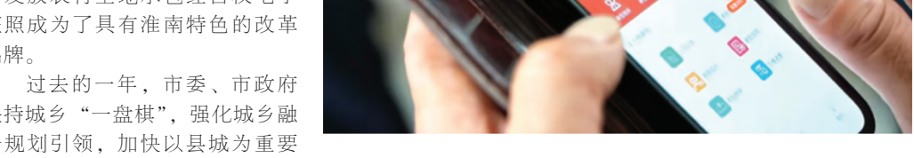
我市创新开展农村土地承包经营权电子证照发放工作。

2024年，我市进一步深化农业生产“大托管”，利用数字技术实地测绘，创新开展了农村土地承包经营权电子证照发放工作，为推动“小田变大田”、促进农业适度规模经营创造了有利条件，成功入选中国改革典型案例。创新发放农村土地承包经营权电子证照成为了具有淮南特色的改革品牌。 过去的一年，市委、市政府坚持城乡“一盘棋”，强化城乡融合规划引领，加快以县城为重要载体的城镇化建设，加强城乡基础设施一体化建设，发展乡村富民产业，加快建设宜居宜业和美乡村，着力构建城乡融合发展新格局，建成高标准农田29.5万亩，粮食总产实现“二十一连丰”。寿县、凤台县荣获全国“平安农机”示范县。规模以上农产品加工业产值增速居全省第7位。“淮畔良品”知名度提升，淮南牛肉汤产业爆发迅速，马店糯米等3个产品入选全国名特优新农产品目录，新增绿色优质农产品83个，总数居全省第一位。新建“四好农村路”530公里，实现建制村通公交全覆盖。建成28个和美乡村省级中心村，18个省级精品示范村加快建设，农村人居环境进一步改善。八公山区获评全国村庄清洁行动先进县。城镇生活垃圾无害化处理率居全省首位，非正规垃圾堆放点治理项目入选全国示范。