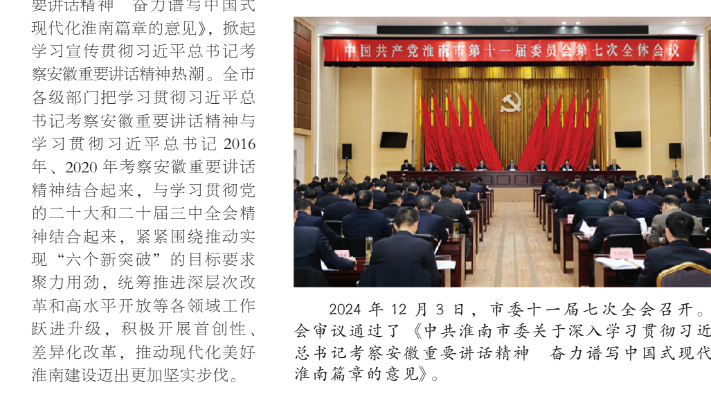
2024年12月3日，市委十一届七次全会召开。全会审议通过了《中共淮南市委关于深入学习贯彻习近平总书记考察安徽重要讲话精神的实施意见》。

2024年9月26日，市委十一届六次全会召开。全会审议通过了《中共淮南市委关于贯彻党的二十届三中全会精神 进一步全面深化改革 奋力谱写中国式现代化淮南篇章的实施意见》。 2024年12月3日，市委十一届七次全会召开。全会审议通过了《中共淮南市委关于深入学习贯彻习近平总书记考察安徽重要讲话精神的实施意见》，掀起学习贯彻习近平总书记考察安徽重要讲话精神的新一轮热潮。