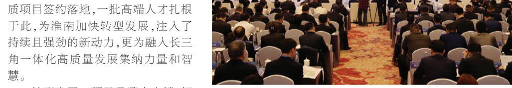
2024年3月30日，第三届淮南转型发展大会召开。

2024年3月30日，第三届淮南转型发展大会隆重举行，紧扣“高质量一体化”主题，现场集中签约重大合作项目58个，总投资630.06亿元。 以国家战略为指引，激发“千帆一道带风轻”的势能，迈向“奋楫逐浪天地宽”的新格局。我市已成功举办三届淮南转型发展大会，推动一批优质项目签约落地，一批高端人才扎根于此，为淮南加快转型发展、注入持续且强劲的新动力，更为融入长三角一体化高质量发展集纳力量和智慧。 转型发展，项目是鼎力支撑，招商是源头活水。2024年，市委、市政府坚持把招商引资作为“第一要事”，常态化举行“投资淮南·月月签”活动，不断优化产业招商专班工作机制，组织代表团出访日本、法国、德国等国家，聚焦北京、上海、浙江等先发达地区，开展淮南市“双招双引”推介会、汽车及零部件产业金融对接会等系列招商推介，引进项目的“含金量”“含新量”不断提升。新引进全球百强、全国百强等知名企业16家，引进亿元以上省外项目资金额增速居全省首位。5家企业入选全省百强名单。蔚来整车二期、路虎汽车座椅等129个亿元以上制造业项目开工，开沃新能源专用车、中环二期等189个亿元以上制造业项目加快建设，航天锂电生产基地等152个亿元以上制造业项目竣工。