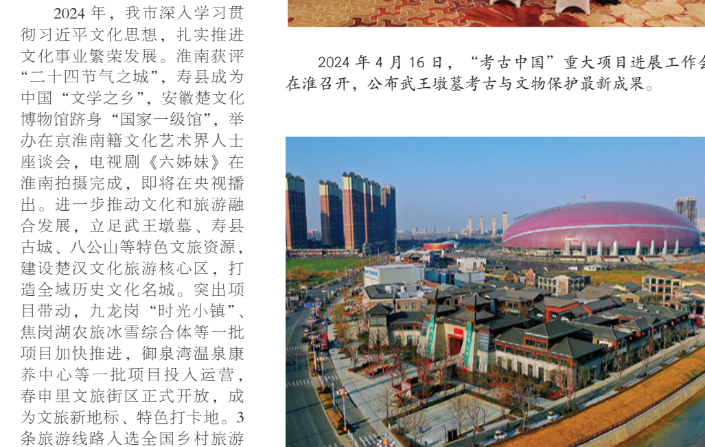
2024年12月28日，春申文旅街区盛大开放。

2024年12月23日，中央广播电视总台发布2024年度国内、国际十大考古新闻，淮南武王墩墓考古入选国内十大考古新闻，其考古价值和历史地位进一步彰显。武王墩墓是迄今为止考古发掘的规模最大、等级最高的楚国极墓，围绕做好武王墩墓的发掘保护传承，现已提取文物1万余件，已编制《淮南武王墩保护规划》《淮南武王墩考古遗址公园规划》，投资7亿元的武王墩遗址博物馆即将开工建设。 2024年，我市深入学习贯彻习近平新时代中国特色社会主义思想，扎实推进文化事业繁荣发展。淮南获评“二十四节气之城”，寿县成为“中国‘文学之乡’、安徽是文化博物馆”“国家一极馆”，举办在京淮南籍文化艺术界人士座谈会，电视剧《六姊妹》在淮南拍摄完成，即将在央视播出。进一步推动文化和旅游融合发展，立足武王墩墓、寿县古城、八公山等特色文旅资源，建设楚汉文化旅游核心区，打造全城历史文化名城。突出项目带动，九龙岗“时光小镇”、鱼岗湖农旅冰雪综合体等一批项目加快推进，御泉湾温泉康养中心等一批项目投入运行。2024年，我市文旅产业实现高质量发展，成为文旅新地标、特色打卡地。3条旅游线路入选全国乡村旅游精品线路，淮南入选“全国最热门的50个宝藏小城”。