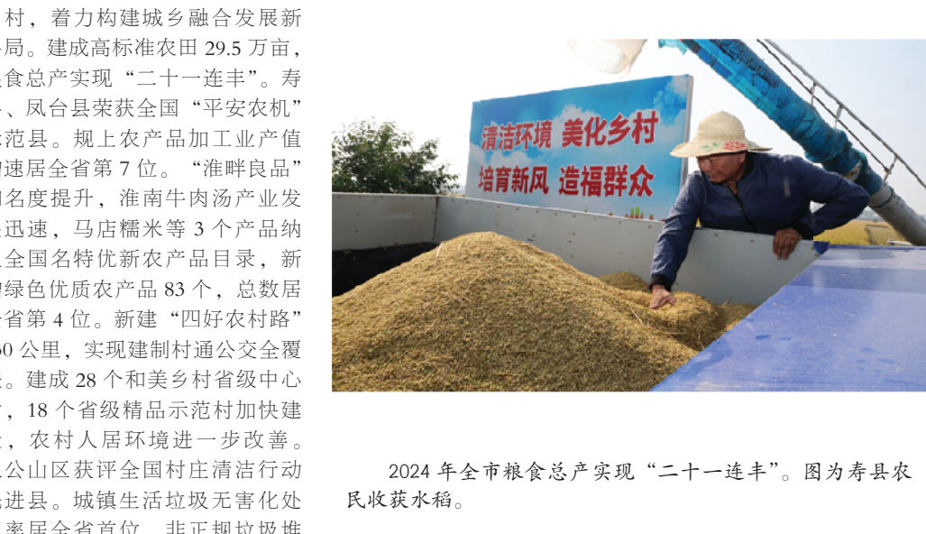
2024年全市粮食总产实现“二十一连丰”。图为寿县农民收获水稻。