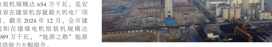
平圩电厂四期工程稳步推进，目前该项目主厂房区域进入内部安装阶段。

2024年12月25日，洛河电厂四期2×1000MW煤电项目主厂房浇筑第一罐混凝土，这一淮南市打造国家级资源型城市可持续发展示范区重点项目进入全面建设阶段。2024年12月12日，正在快速推进的平圩电厂四期第2台机组完成大板梁吊装，建成后总装机规模达654万千瓦，是安徽省在建装机容量最大的电厂项目。截至2024年12月，全市建成和在建煤电机组装机规模达1989万千瓦，“能源之郡”能源保供能力大幅提升。 2024年，我市扎实推进国家新型综合能源基地建设，持续推动煤炭清洁高效安全利用，做精“煤文章”；稳步推进煤电机组、电网建设和优化升级，做强“电保障”；不断促进新型能源高质量发展，提升“绿能矩阵”。二氧化碳基聚碳链多产、碳捕集综合利用等项目陆续开工，建成11个煤化工产业项目，煤化工园区循环“零碳”经济产业链加速构建。2024年全年产气1876.6万立方米，加工处理二类天然气标准。全市已建成风光新能源装机规模325万千瓦，占全市总装机规模18.1%，全年新能源发电量29.6亿度。全市新能源产业实现从无到有、蓄势待发的实质性突破，预计全年产值突破60亿元。