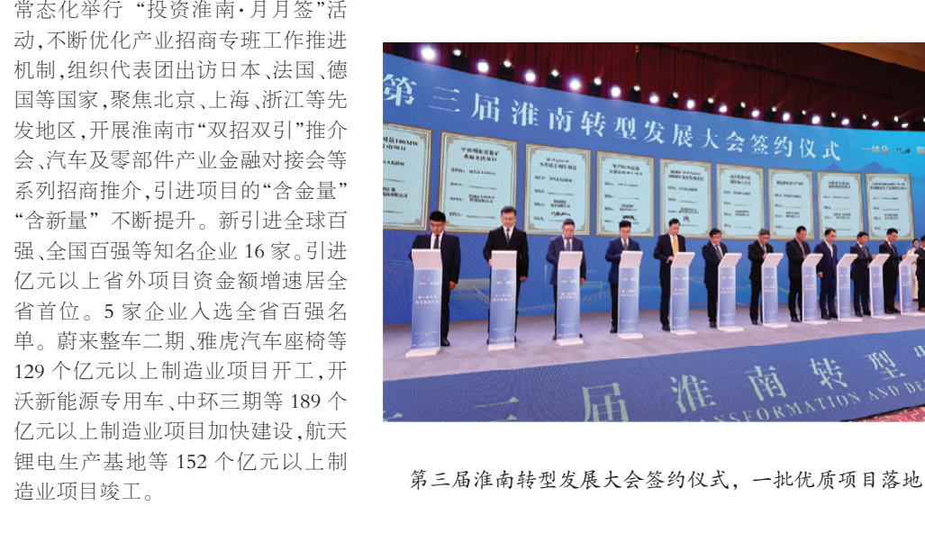
第三届淮南转型发展大会签约仪式，一批优质项目落地。