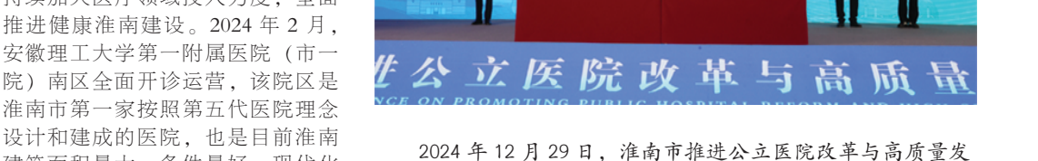
2024年12月29日，淮南推进公立医院改革与高质量发展大会召开并进行多个合作项目签约。

2024年10月，我市成功入选中央财政支持公立医院改革与高质量发展示范项目，获批项目总投资12.4亿元，其中中央补助资金5亿元。该示范项目的启动实施，为全市公立医院发展注入了新的动力。 时不我待守护健康，做实服务深化改革。我市坚持以人民为中心，持续加大医疗领域投入力度，全面推进健康淮南建设。2024年2月，安徽理工大学第一附属医院（市第一医院）南区全面开诊运营，该院区是淮南市第一家按照第五代医院理念设计和建成的医院，也是目前淮南建筑面积最大、条件最好、现代化水平最高的院区，开诊以来为淮南市及周边区域群众提供全方位全周期的健康服务和医疗保障。市卫生健康委与上海中医药大学附属曙光医院托管运营市中医医院，将提高淮南市中医医疗水平和医疗资源区域辐射能力，打造长三角地区优质医疗资源扩容下沉标杆。市妇幼保健院晋升为三级妇幼保健院，市第四人民医院山南院区加快建设。 我市将以示范项目建设为契机，深化以公益性为导向的公立医院综合改革，引导各级公立医院在医疗水平、管理体制、服务模式等方面进行全面革新，全力推动医疗水平全面提升，深入学习推广三明医改经验，大力实施惠民利民新举措，努力让群众在家门口看好病、少花钱、少跑腿。