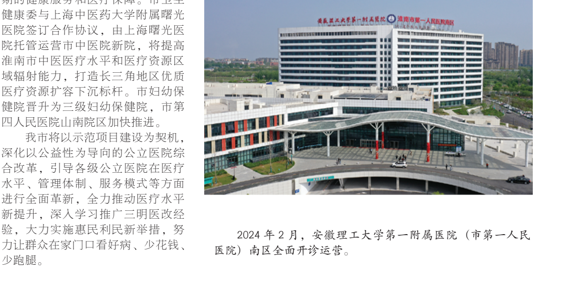
2024年2月，安徽理工大学第一附属医院（市第一医院）南区全面开诊运营。