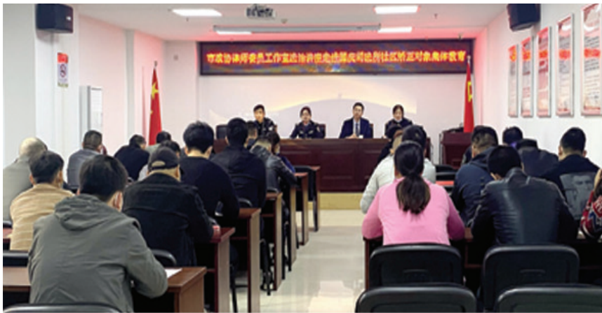
对社区矫正对象集体教育

淮南市政协律师委员工作室成立于2022年6月，入驻政协委员14人，是全省第一家律师委员工作室，也是淮南第一家行业类委员工作室。