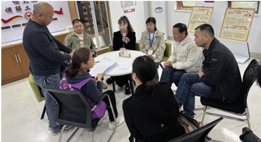
政协委员参与案件调解

谢家集区人民法院政协委员工作室成立于2023年7月，现入驻政协委员12人。成立以来，始终坚持“三诊工作法”，促进矛盾纠纷源头化解和基层社会治理。