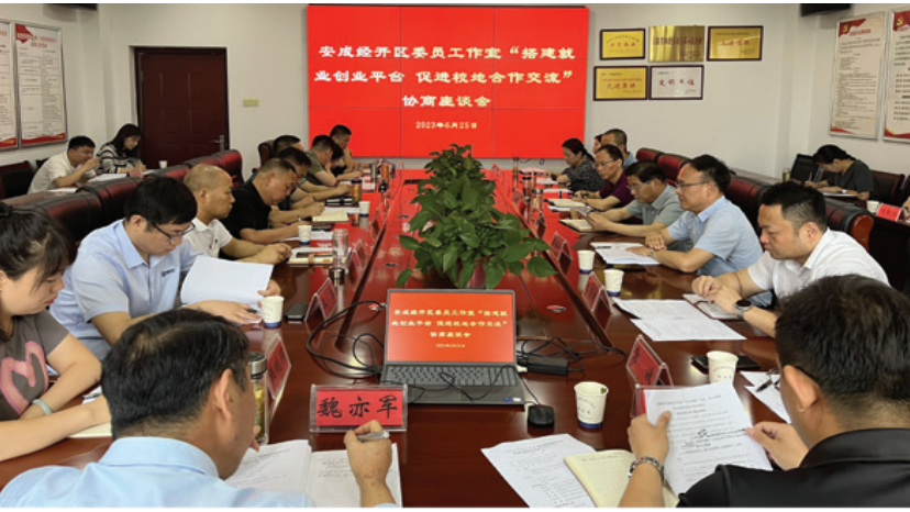
举行“搭建就业创业平台 促进校地合作交流”协商座谈会

田家庵区安成经济开发区政协委员工作室成立于2020年5月，设有功能型党支部，入驻商务、人社、科技、金融、税务等系统的省市区三级政协委员17人，是田家庵区政协第一个功能性委员工作室。2023年，入选全省政协“委员工作室巡礼”在省政协网站等展播，省内外多地政协前来考察学习。