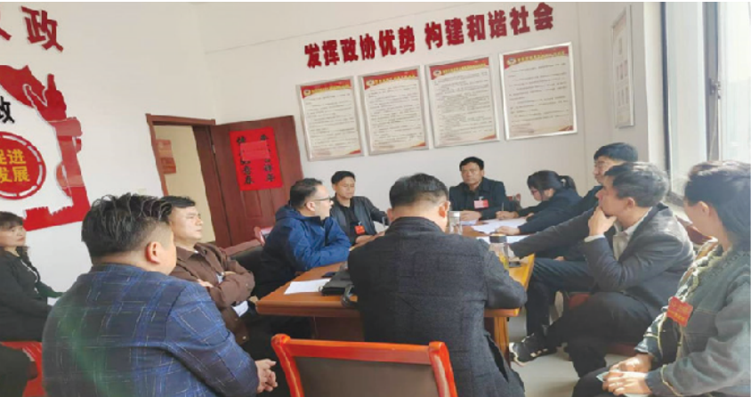
协商提出窑口镇2024年度急需实施的十项民生实事建议

寿县窑口镇政协委员工作室成立于2020年6月，入驻政协委员6人。成立以来，深入开展学习交流、传递政情、反映民意、协商监督、服务民生、团结联谊等工作，现已形成“党委领导，政府支持，政协搭台，各方参与，群众点赞”的协商工作机制，履职成效明显，省内外各级政协组织到场考察调研指导20次。