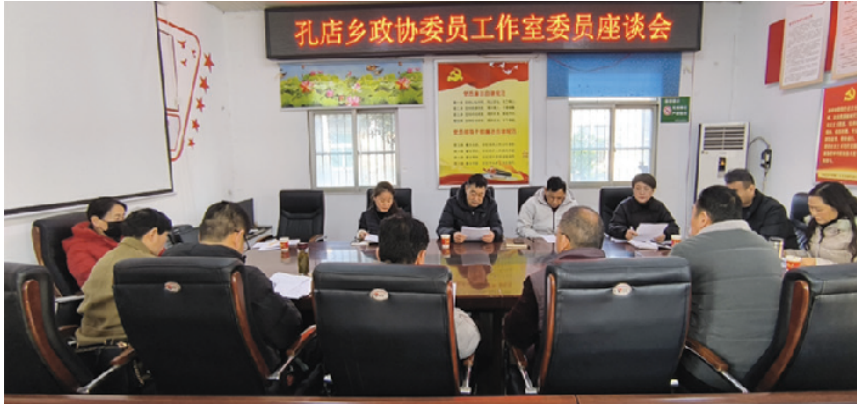
围绕土地承包经营权二轮延包召开座谈会

大通区孔店乡政协委员工作室成立于2023年3月，入驻政协委员16人。成立以来，聚焦服务“三农”、完善基层治理等积极开展协商议事，助力履职成果转化。