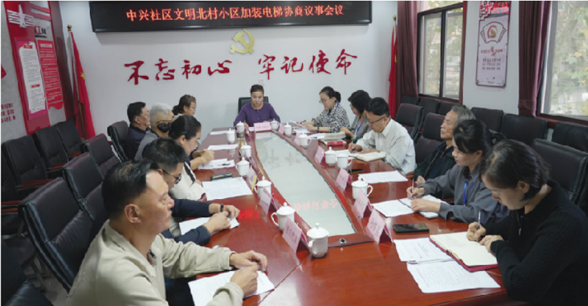
聚焦“小区加装电梯”开展协商

田家庵区洞山街道中兴社区政协委员工作室成立于2019年7月，入驻省市区三级政协委员18人，是全市首个政协委员工作室，也是田家庵区政协探索创新协商的具体实践。