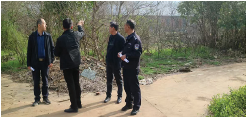
调研皖淮机械厂旧址提出保护性开发建议

八公山区毕家岗街道新建社区政协委员工作室成立于2021年5月，入驻政协委员20人。工作室坚持民意收集、议事、协商在一线，积极反映社情民意，为群众办实事、解难题。