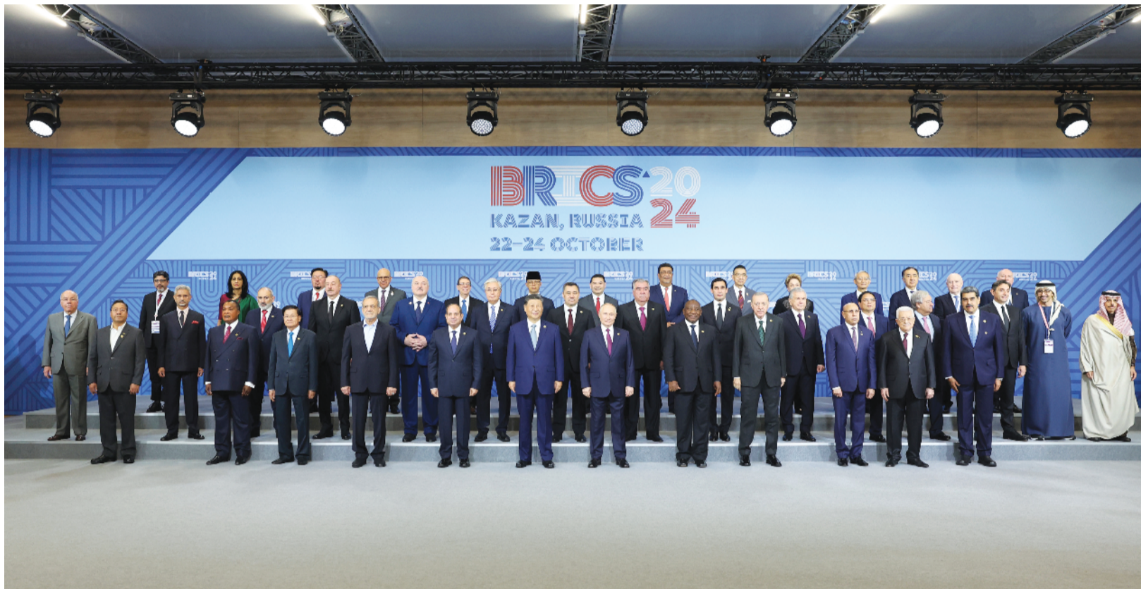
当地时间10月24日上午，国家主席习近平在喀山会展中心出席“金砖+”领导人对话会并发表题为《汇聚“全球南方”磅礴力量 共同推动构建人类命运共同体》的重要讲话。这是出席对话会的金砖国家及嘉宾国领导人或代表、国际组织负责人集体合影。