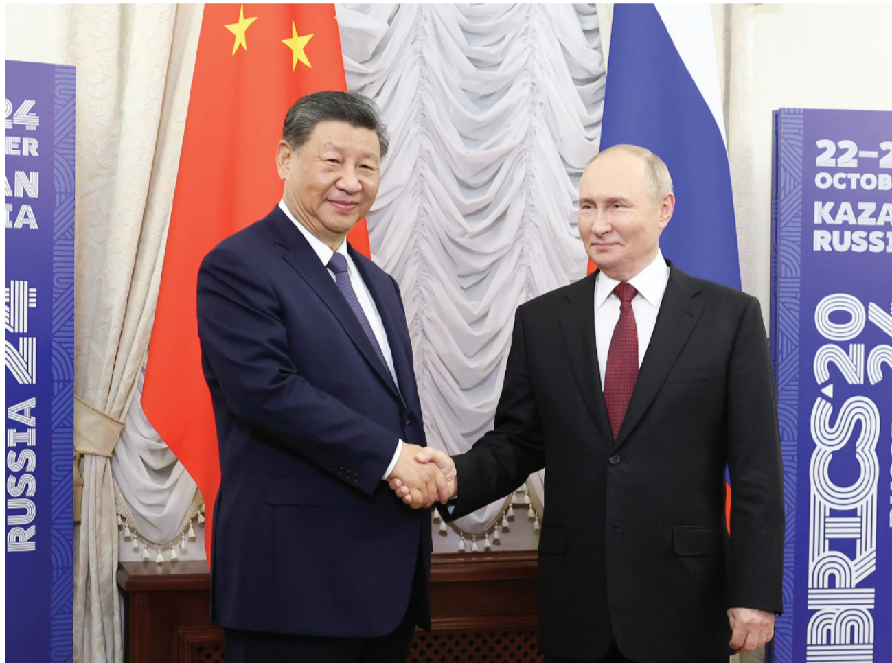
当地时间10月22日下午,国家主席习近平在喀山克里姆林宫同俄罗斯总统普京举行会晤。

新华社俄罗斯喀山10月22日电(记者 郝薇薇 黄河)当地时间10月22日下午,国家主席习近平在喀山克里姆林宫同俄罗斯总统普京举行会晤。 习近平指出,今年是中俄建交75周年。75年来,中俄关系风雨兼程,探索出“不结盟、不对抗、不针对第三方”的相邻大国正确相处之道。双方秉持永久睦邻友好、全面战略协作、互利合作共赢精神,不断深化和拓展全面战略协作和各领域务实合作,为推动两国发展振兴和现代化建设注入强劲动力,为增进中俄人民福祉、维护国际公平正义作出重要贡献。当前,世界正处于百年未有之大变局,国际形势变乱交织,但中俄世代友好的深厚情谊不会变,济世为民的大国担当不会变。尽管面临复杂严峻的外部形势,两国贸易等各领域合作积极推进,大型合作项目稳定运营。双方要继续推动共建“一带一路”倡议和欧亚经济联盟深入对接,为促进各自经济高