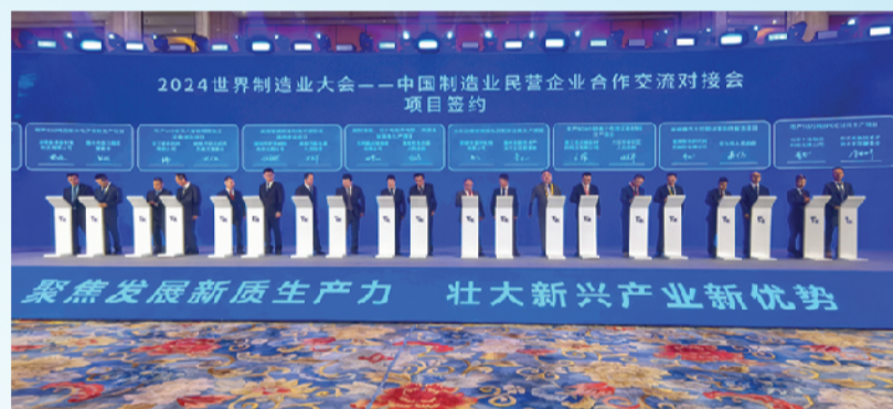
会上进行了项目集中签约，凤台县杭州鹏成新能源有限公司新型储能、动力电池和电芯、充换电站装备项目参加签约。