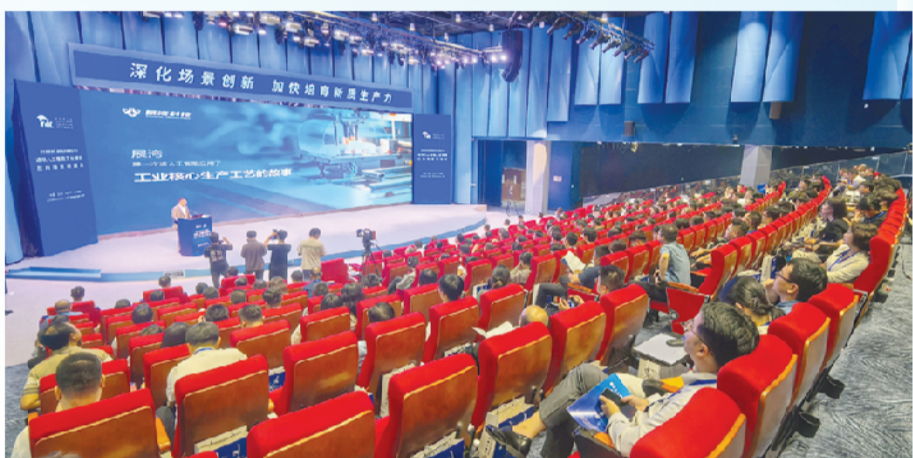
2024世界制造业大会通用人工智能工业领域应用场景对接会在合肥成功举办。