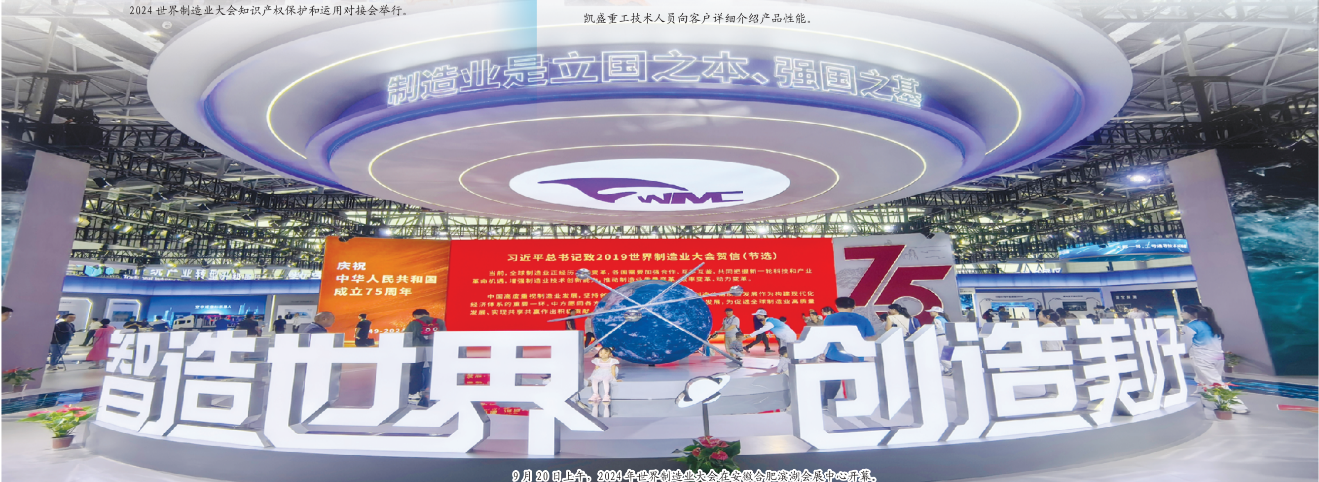
9月20日上午，2024年世界制造业大会在安徽合肥滨湖会展中心开幕。