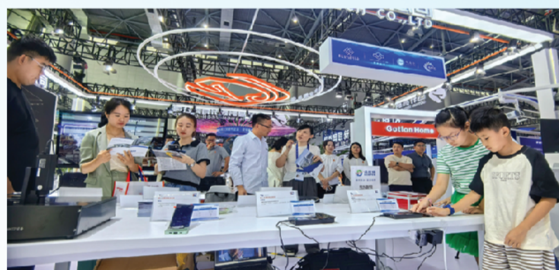
安徽芯视佳半导体显示科技有限公司吸引不少参观者驻足观看。