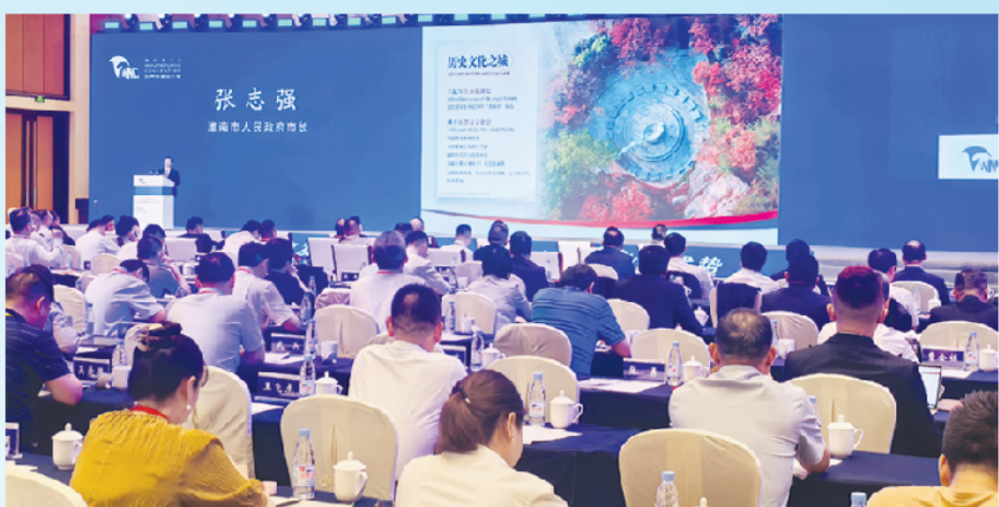
9月20日，中国制造业民营企业合作交流对接会在合肥举行。