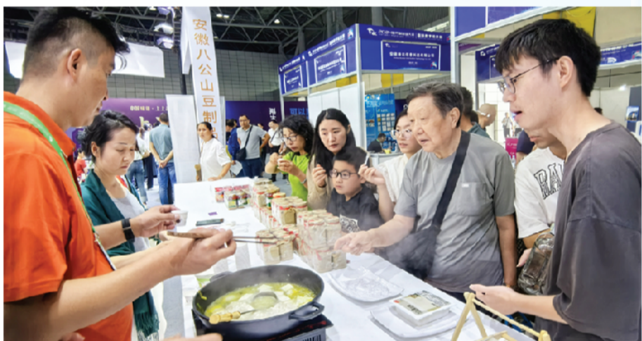
淮南豆腐展台前吸引众多参观者。