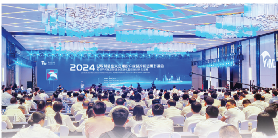
2024世界制造业大会知识产权保护和运用对接会举行。