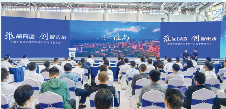
9月22日上午，淮南新能源汽车零部件产业专场发布会在合肥滨湖会展中心召开。