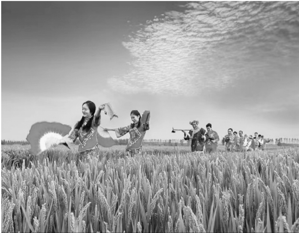
百姓大舞台

生活需要“钝感力”,它不是麻木不仁,而是一种智慧的选择。尤其在智能化浪潮的今天,我们很容易被各种夸大其词、捕风捉影的信息所误导,只有学会快速忘却不快,接受失败继续挑战的能力,练就“他强任他强,清风拂山岗”心境,才不会受琐碎小事所左右,更好地从容面对生活的挑战,专注自己的成长,实现自己的价值。