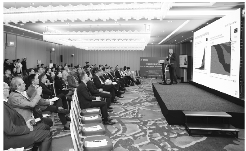
“2024中关村论坛——布鲁塞尔平行论坛”聚焦中欧低碳合作

莱希说,如果能够提供必要平台,非洲国家也可以在科技创新上取得突破。伊朗专家有能力建造先进的炼油厂和发电厂,这项能力对于扩大伊朗与非洲国家的合作相当重要。莱希呼吁消除伊朗与非洲国家关系发展的障碍,并为双方关系发展进行必要的基础设施建设。