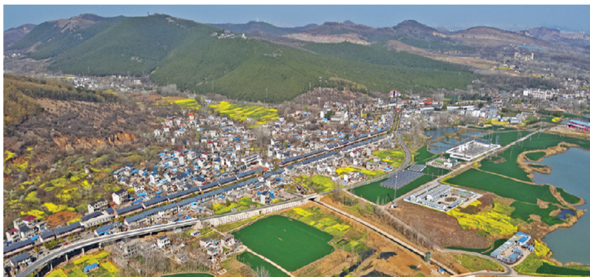
八公山下如诗如画