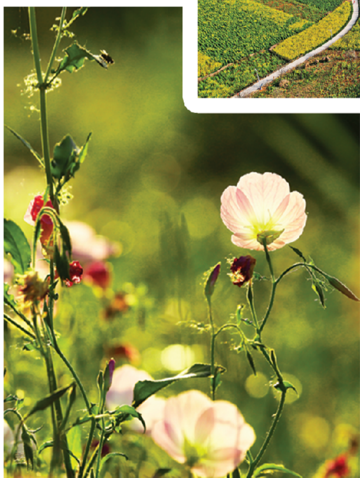
暖阳下，春花娇艳欲滴