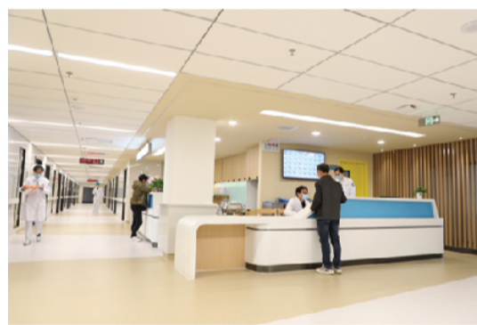
环境优美的住院病区