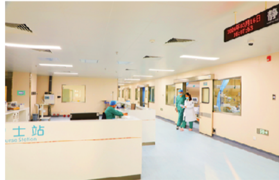
重症监护室全力以赴救治患者