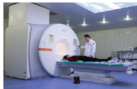
生命矩阵系统磁共振设备