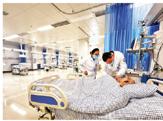
急诊急救中心火线救治