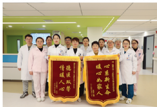
南区开诊一个月各科室纷纷获赠锦旗