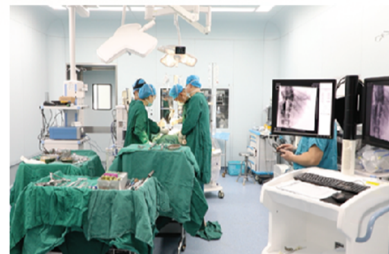
上海专家南区开展先天性脊柱侧弯矫形手术