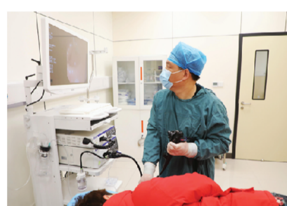
消化内镜中心全面启用