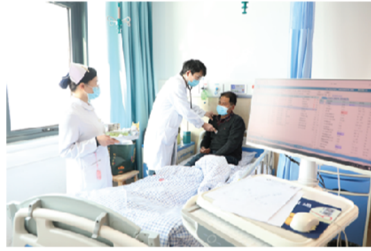
移动查房 便捷高效