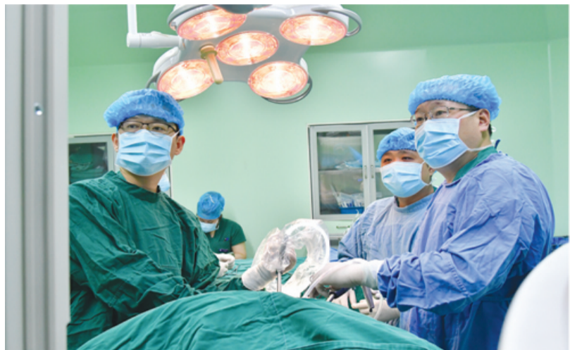
肺小结节诊断门诊：为患者健康呼吸不遗余力

日常生活中，患者或许会遭遇疑难杂症，或许会面对“难言之隐”，或许会烦恼于难以摆脱的痼疾……这个时候，医疗机构的特色门诊便责无旁贷。多学科协作，融汇专家、技术、设备力量，完善诊疗，精准发力，贴心服务，淮南新华医疗集团新华医院响应患者需求，成立特色门诊，正铸就“特”字为优势、守护百姓健康的方舟。