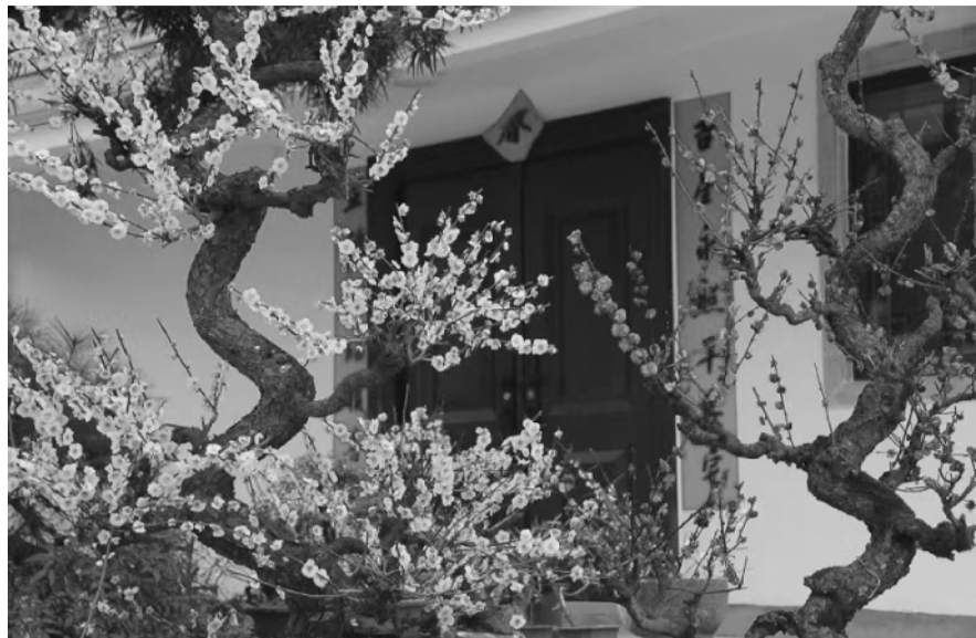
迎春 徐金陵 撰