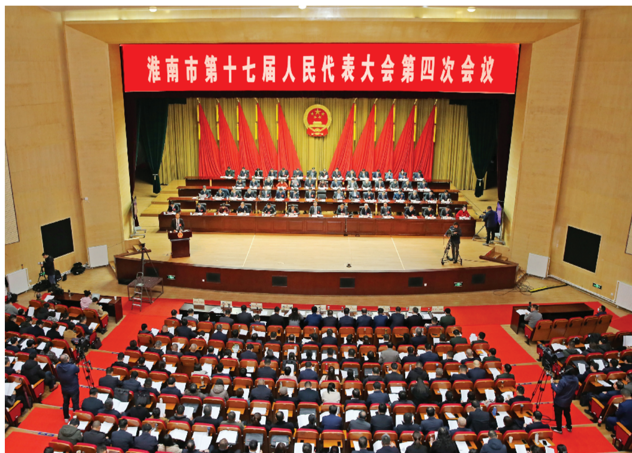
1月16日上午,淮南市第十七届人民代表大会第四次会议在市政务中心开幕。

报告强调,一年来,面对多重困难挑战和艰巨繁重任务,我市奋力推动经济企稳回升,深入实施五大攻坚行动,办成了一批事关发展的大事要事,解决了一批群众关心的急事难事,凝聚了共识、提振了信心、增强了斗志。主要做了以下工作:聚焦实干争先,发展态势持续向好;聚焦引育并举,产业转型升级加快;聚焦宜居宜业,城市更新加快实施;聚焦强农富民,乡村振兴扎实推进;聚焦系统治理,生态修复成效明显;聚焦民生福祉,社会治理不断深化;聚焦