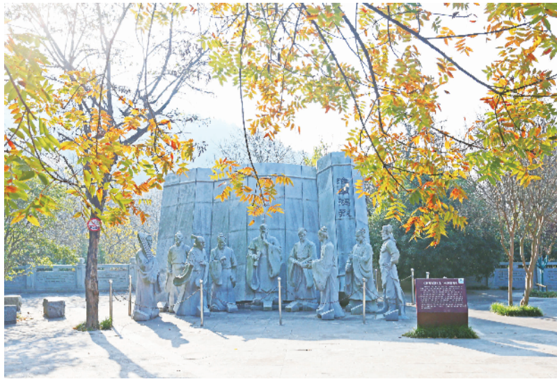
八公山国家地质公园内八公雕像