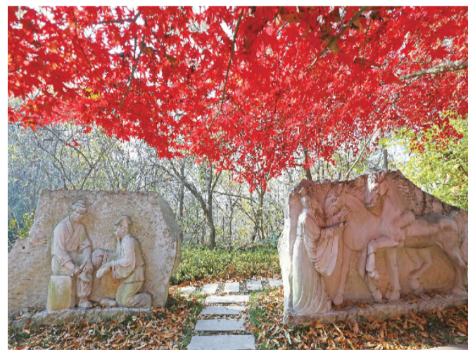
淮南子文化园成语典故石雕