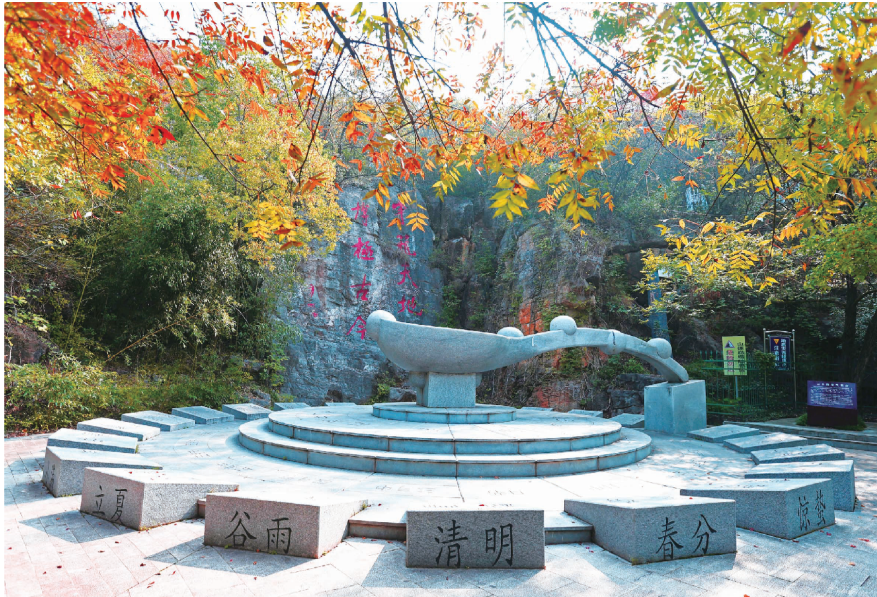
八公山国家地质公园二十四节气园