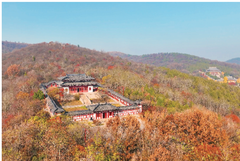
掩映山中的汉淮南王宫