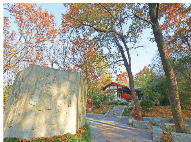
鸿烈书院外层林尽染