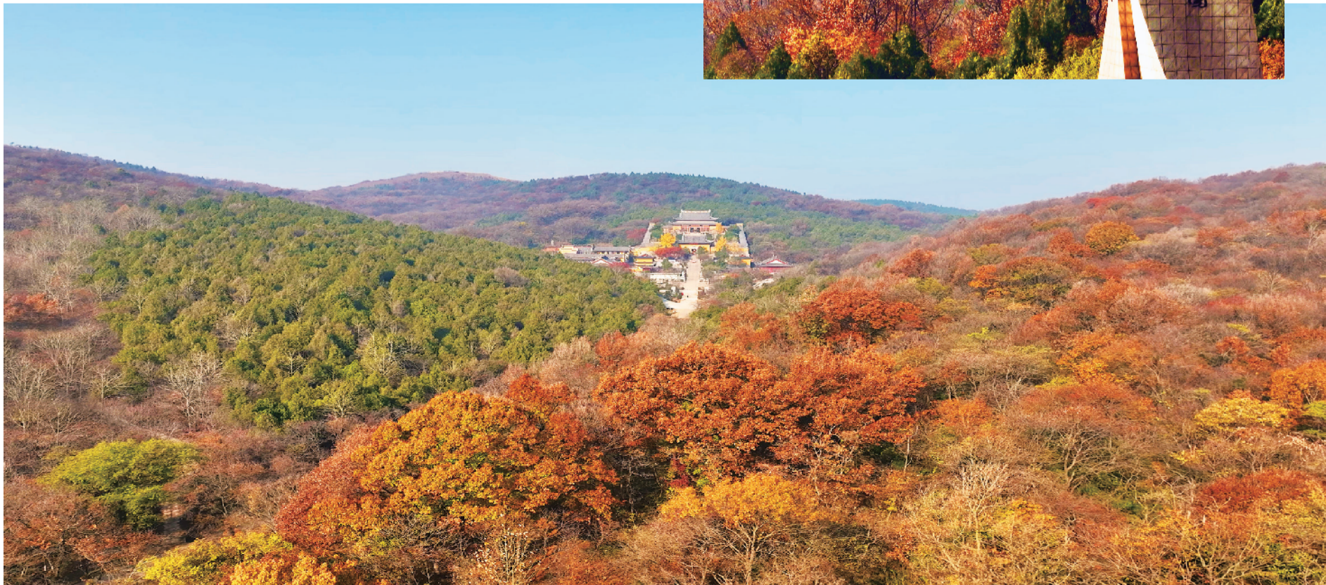
八公山国家地质公园初冬景色秀美