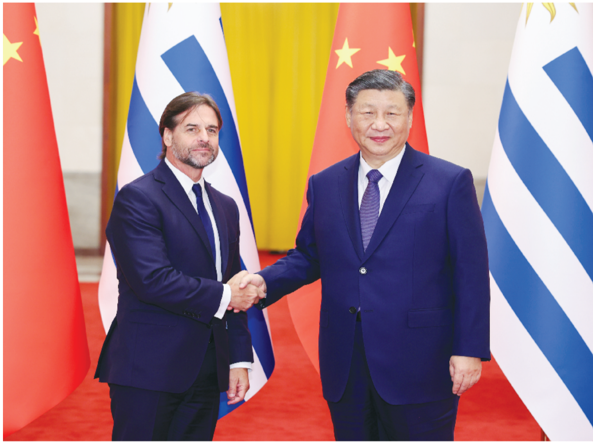
十一月二十二日下午，国家主席习近平在北京人民大会堂同乌拉圭总统拉卡列举行会谈。这是会谈前，习近平在人民大会堂北大厅为拉卡列举行欢迎仪式。

新华社北京11月22日电（记者杨依军）11月22日下午，国家主席习近平在人民大会堂同乌拉圭总统拉卡列举行会谈。两国元首宣布，将中乌关系提升为全面战略伙伴关系。