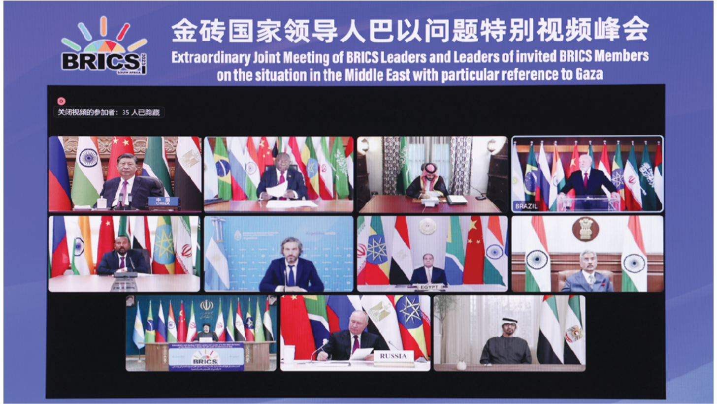
11月21日晚，国家主席习近平出席金砖国家领导人巴以问题特别视频峰会并发表题为《推动停火止战 实现持久和平安全》的重要讲话。

新华社北京11月21日电 11月21日晚，国家主席习近平出席金砖国家领导人巴以问题特别视频峰会并发表题为《推动停火止战 实现持久和平安全》的重要讲话。 习近平指出，本次峰会是金砖扩员后的首场领导人会晤。当前形势下，金砖国家就巴以问题发出正义之声、和平之声，非常及时、非常必要。加沙地区的冲突已持续一个多月，造成大量平民伤亡和人道主义灾难，并出现扩大外溢趋势，中方深表关切。当务之急，一是冲突各方要立即停火止战，停止一切针对平民的暴力和袭击，释放被扣押平民，避免更为严重的生灵涂炭。二是要保障人道主义救援通道安全畅通，向加沙民众提供更多人道主义援助，停止强制迁移、