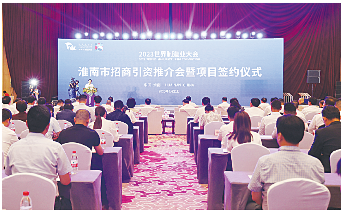
9月21日下午,2023世界制造业大会淮南市招商引资推介会暨项目签约仪式在淮南迎宾馆举行。

任泽锋出席 张志强主持 陈儒江蔡宜骅出席 集中签约项目57个,总投资283.46亿元