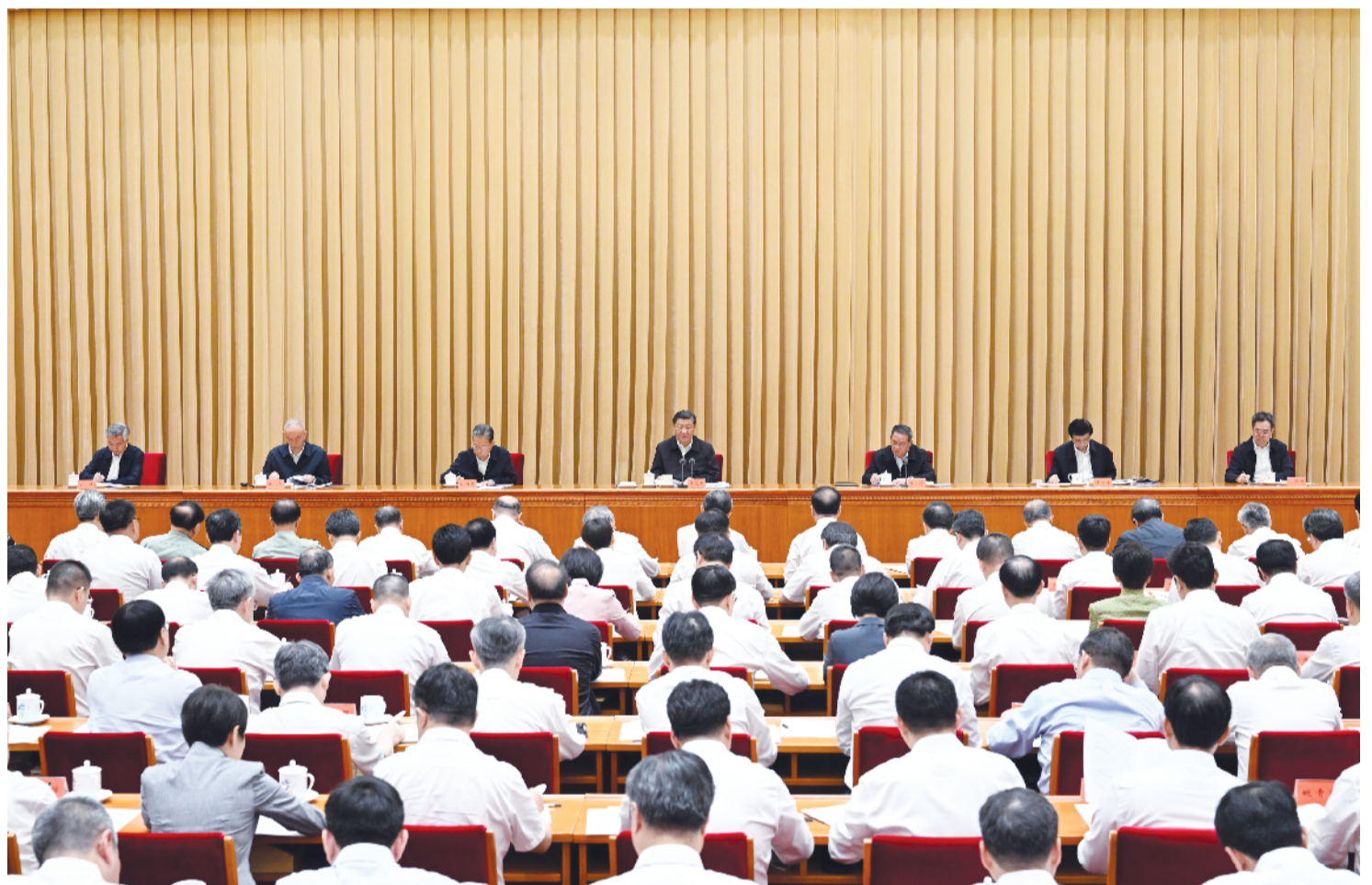
7月17日至18日,全国生态环境保护大会在北京召开。中共中央总书记、国家主席、中央军委主席习近平出席会议并发表重要讲话。李强、赵乐际、王沪宁、蔡奇、丁薛祥、李希出席会议。

新华社北京7月18日电 全国生态环境保护大会17日至18日在北京召开。中共中央总书记、国家主席、中央军委主席习近平出席会议并发表重要讲话强调,今后5年是美丽中国建设的重要时期,要深入贯彻新时代中国特色社会主义生态文明思想,坚持以人民为中心,牢固树立和践行绿水青山就是金山银山的理念,把建设美丽中国摆在强国建设、民族复兴的突出位置,推动城乡人居环境明显改善、美丽中国建设取得显著成效,以高品质生态环境支撑高质量发展,加快推进人与自然和谐共生的现代化。