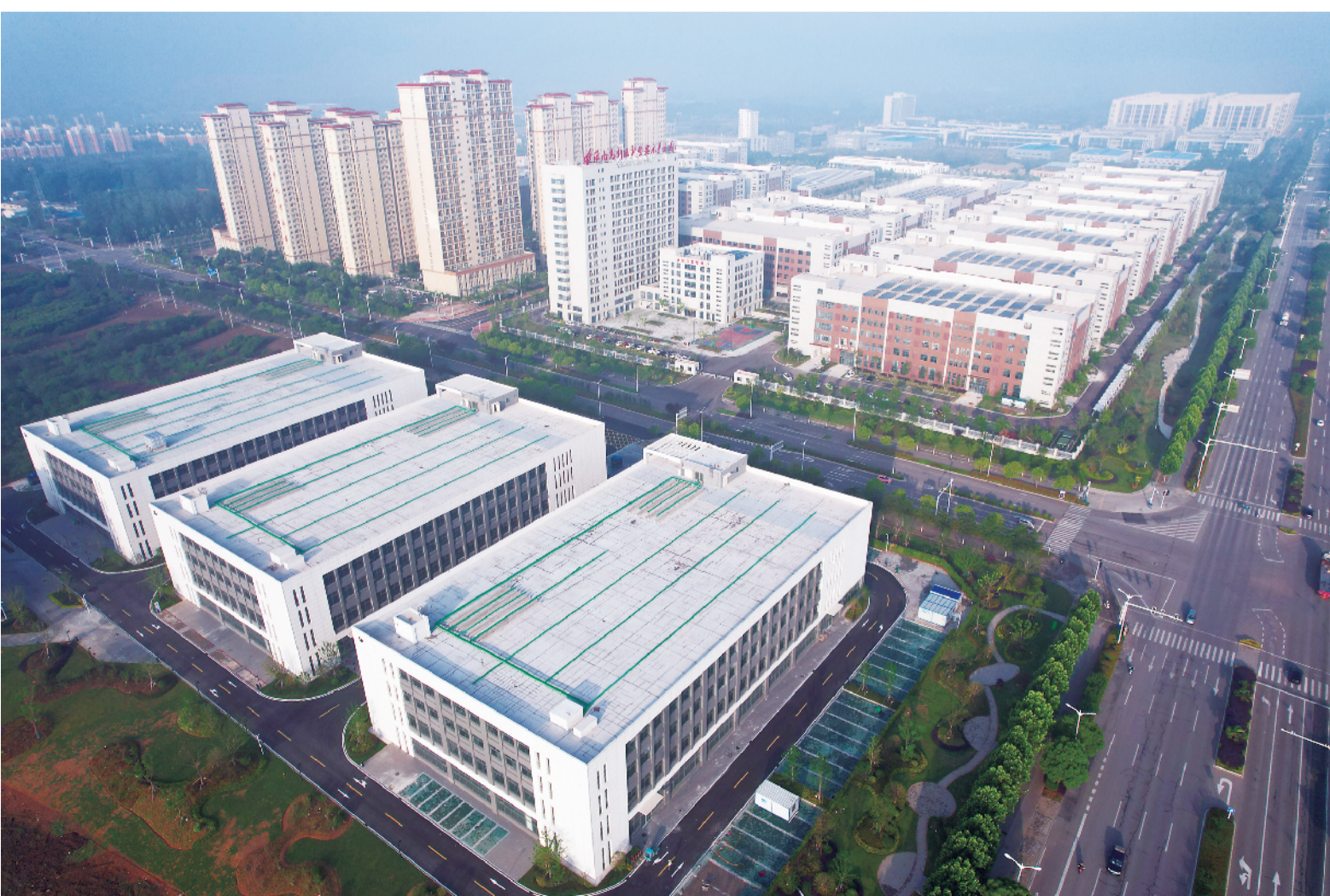
淮南高新区新型显示产业园

同年9月，市第十一次党代会召开，会议发出了新时代老工业城市“重振雄风”的动员令。这次会议上，市委提出：扎实推进产业转型、