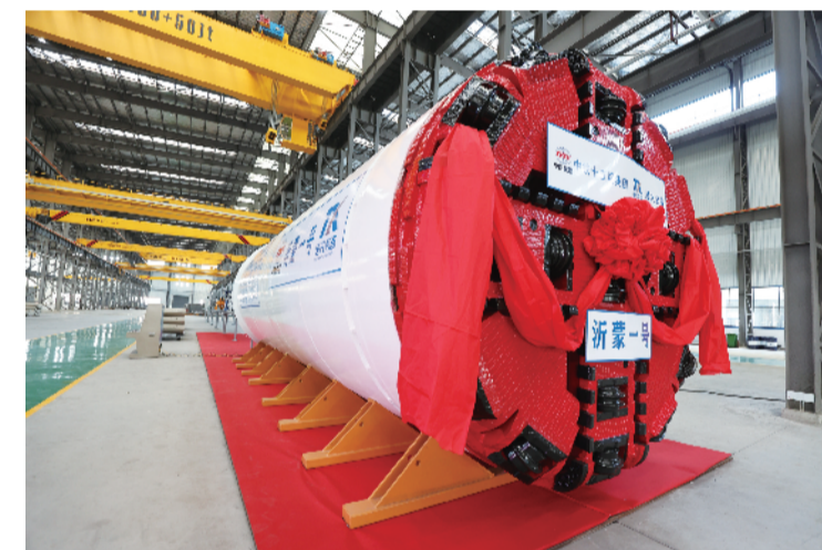
安徽省民营企业首台盾构机在安徽唐兴装备科技子公司下线

●2022年8月13日，召开的淮南建设国家新型综合能源基地座谈会上，现场集中签约了10个项目，总投资330亿元。2023年2月18日，第二届淮南转型发展大会现场集中签约项目50个，投资总额562.83亿元。