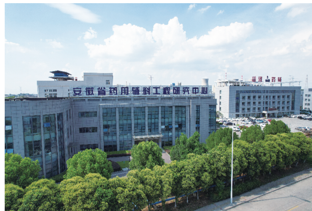
安徽淮南生物医药工业园一景