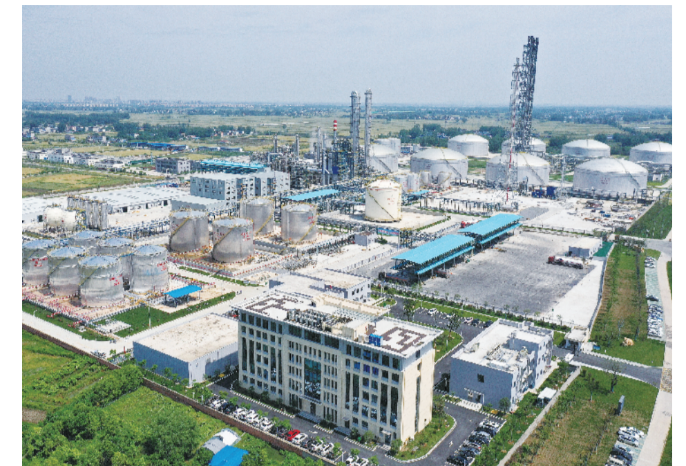
安徽嘉新新材料科技有限公司