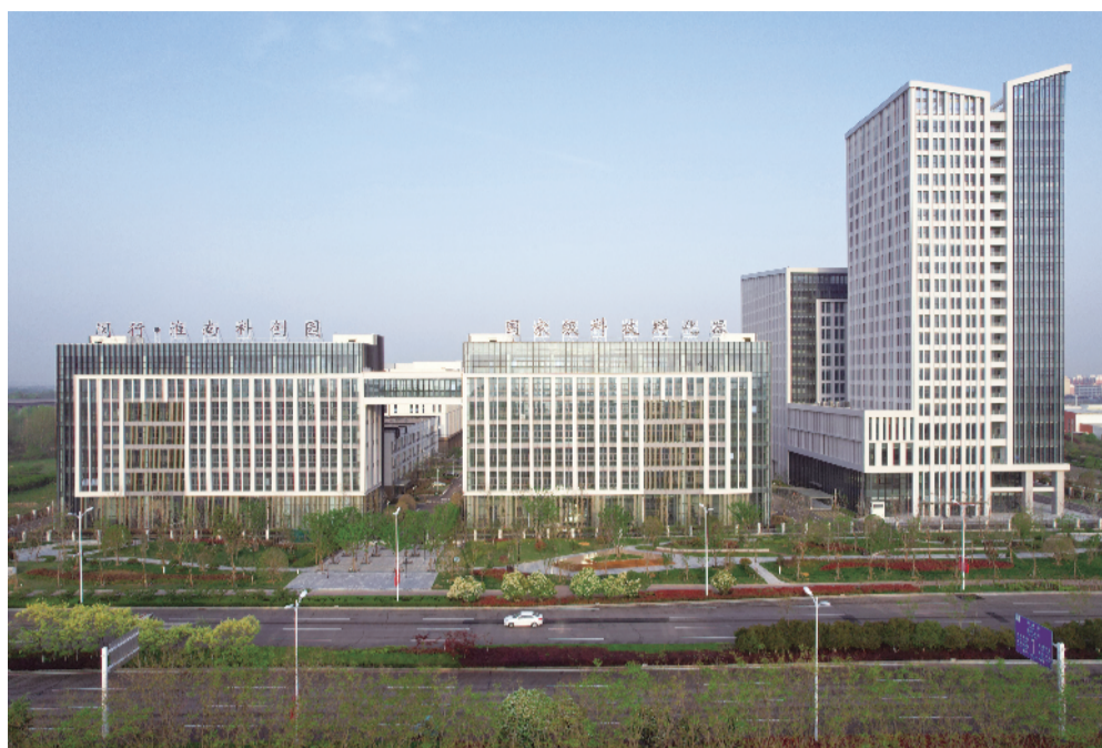
国家级科技孵化器闵行·淮南科创园