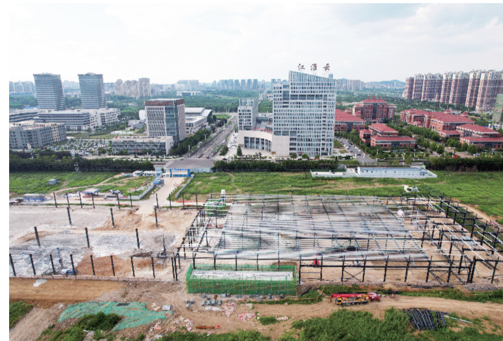
新能源汽车及装备制造产业园(开沃汽车)项目已开工建设(7月12日报)