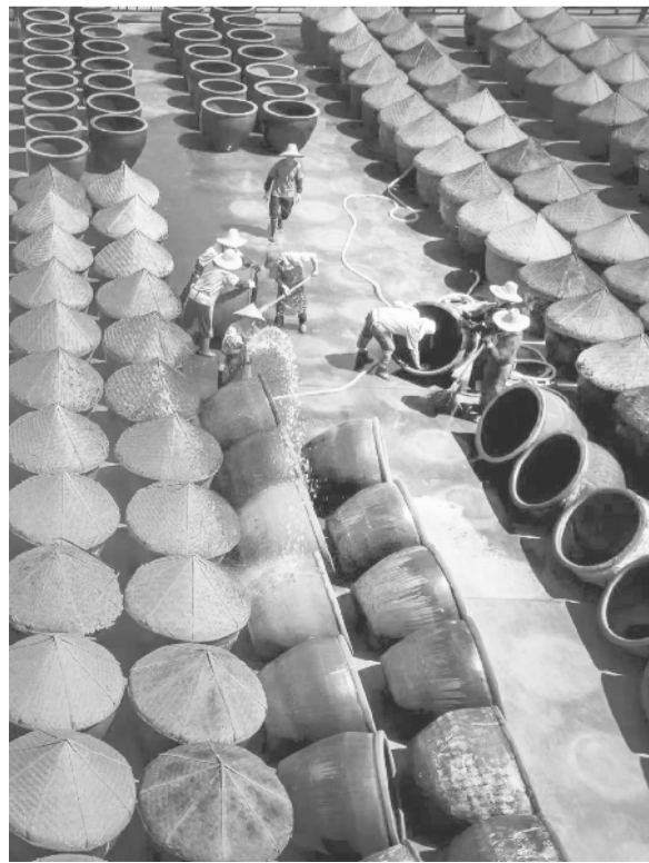
迎来蔷薇的季节

这趟回家的行程，让我看清了爱的面目。正如那一个个粽子，揭开了外壳后，显出了始终包裹着的柔软的心。一个个粽子，风味各异，但留到最后的，都是淡淡却令人无法忘怀的香。