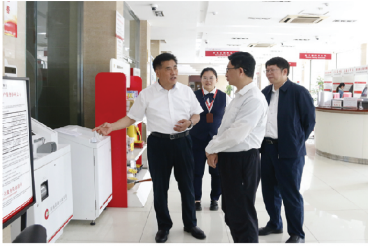
5月25日，省联社党委委员、驻省联社纪检监察组组长朱庆海到淮南通商农商银行调研。驻省联社纪检监察组有关同志陪同。

朱庆海听取了淮南通商农商银行党委加强党的建设、推进改革发展和防范化解风险等方面的汇报，以及该行纪委工作情况汇报。他强调，一要坚持把准政治方向，毫不动摇坚持党对金融工作的全面领导。要不断加强党委自身建设，扎实开展好主题教育，深入学习贯彻习近平总书记关于金融工作的重要论述，认真抓好中央和省、省政府决策部署的贯彻落实，坚守支农支小定位不动摇，坚持把防范化解金融风险落到实处，选好干部、用好干部、管好干部，充分展现党员先进性引领作用。二要保持战略定力，不断把全面从严治党引向深入。要充分认识到全面从严治党极端重要性，切实增强管党治党意识，落实管党治党责任，加强党员干部职工合规教育、纪律教育、法律教育，将反腐败工作关口前移。三要牢固树立规矩意识，从严从紧抓好制度执行。党委班子成员要规范制定制度、带头执行制度，让制度“长牙”，保持制度刚性，坚持从严执纪，严肃处理违规违纪行为，切实做到早发现早处理。