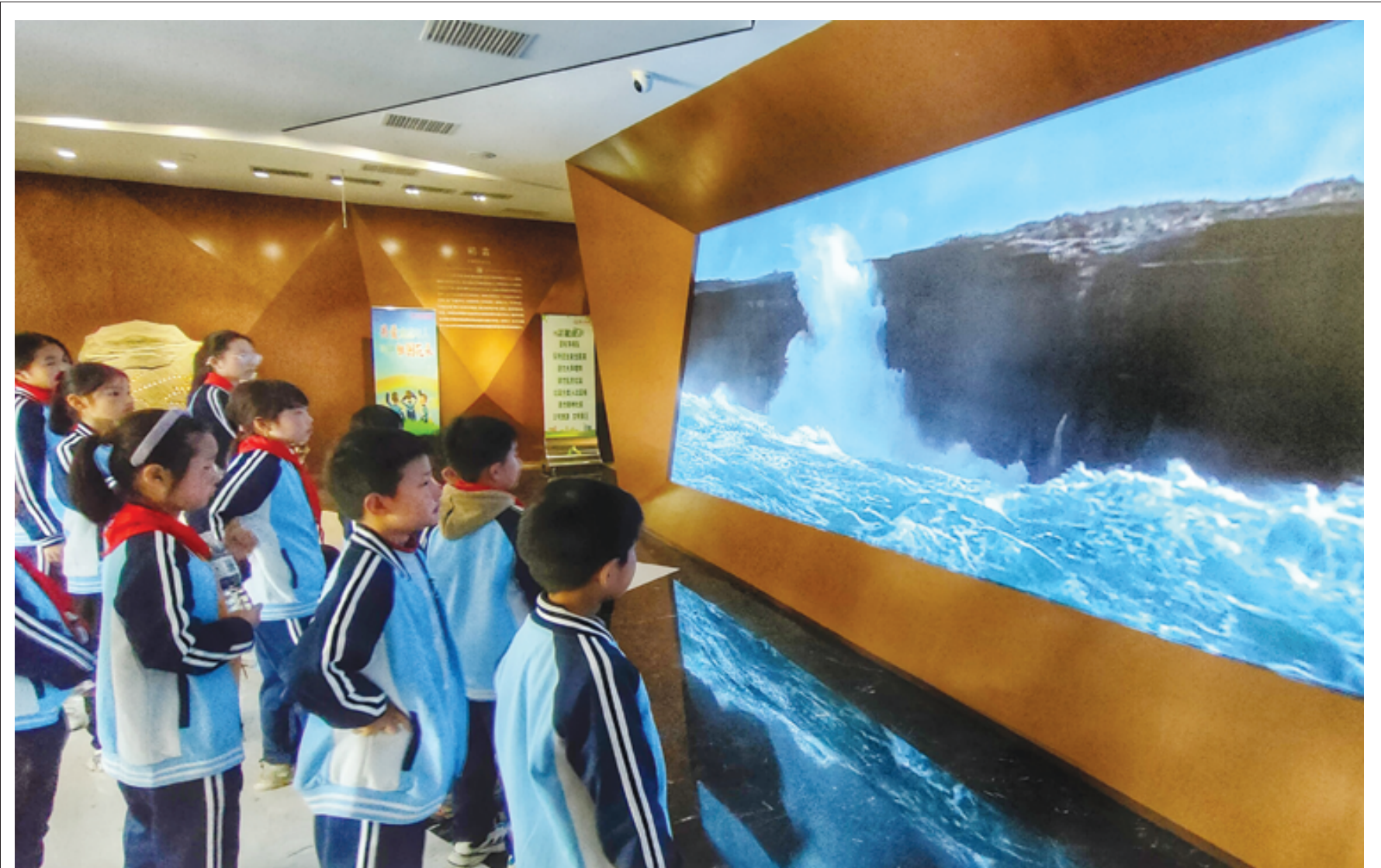
感受生命演化神奇魅力

位于八公山风景区的八公山地质博物馆，以艺术展板和丰富多彩的化石标本为基础，结合多种形式的声光电多媒体展示形式，融合科技互动和沉浸式体验等领先的现代展示手段，多层次、全方位展示八公山作为“蓝色星球”上生命之源和地质科研圣地的风采和魅力。游客们纷纷前往该馆参观游览，聆听“生命起源”的故事，感受生命演化的神奇魅力。