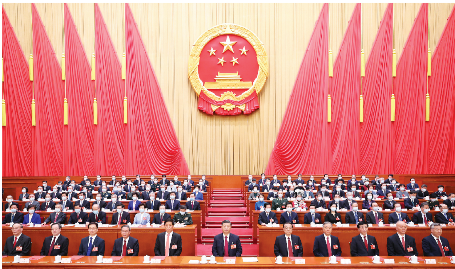
3月13日,第十四届全国人民代表大会第一次会议在北京人民大会堂闭幕。习近平等党和国家领导人在主席台就座。

新华社北京3月13日电 中华人民共和国第十四届全国人民代表大会第一次会议,在圆满完成各项议程,产生新一届国家机构组成人员后,13日上午在北京人民大会堂闭幕。