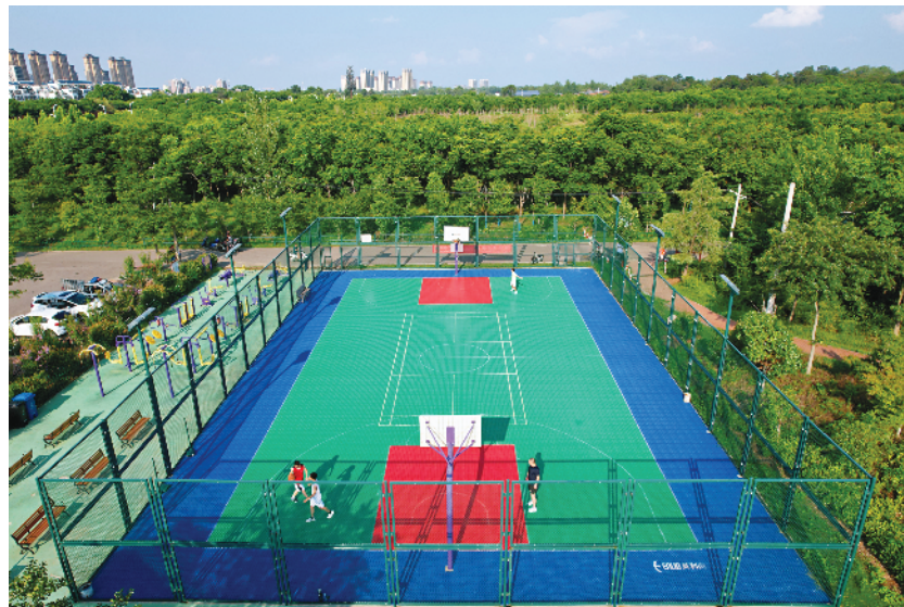
▲体育健身设施为民造福。

盛夏时节，万木葱郁、林壑秀美、峰峦叠翠的舜耕山连绵起伏在淮南东部地区。近年来随着城市建设的扩容和提升，舜耕山日益成为山北主城区与山南高新区的一座“城中山”，城中有山、山中有城、生态优美、和谐宜居。近日，记者通过无人机航拍了一组画面，请读者一起来欣赏我们身边的美丽舜耕山。