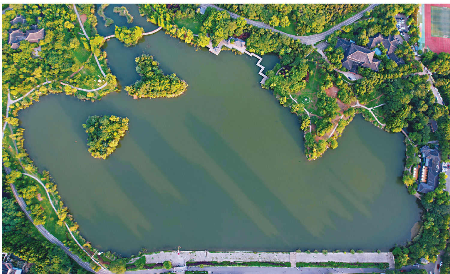
◀空中视角的老龙眼水库。