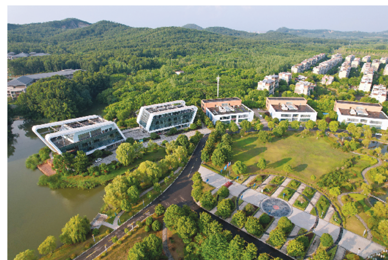
◀别具匠心的花园式建筑。