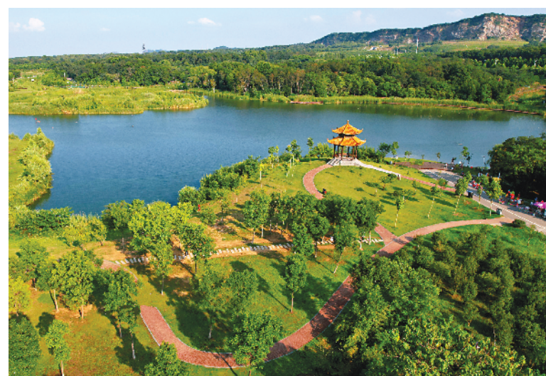
◀昔日煤矿陷区，如今美丽湿地。