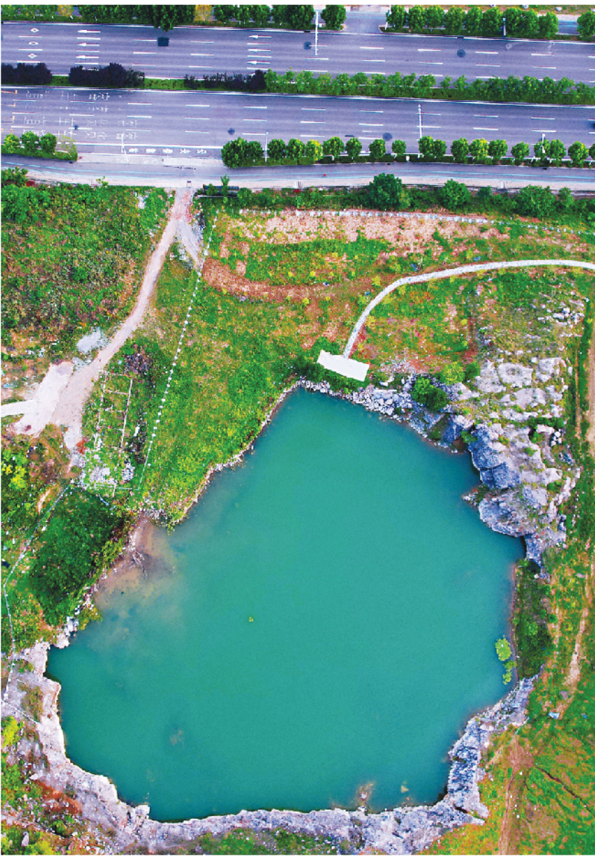
▲环山路东段的一块“绿宝石”。