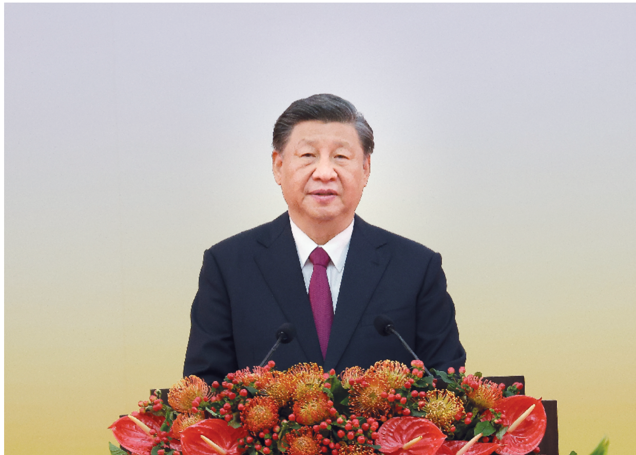
7月1日上午,庆祝香港回归祖国25周年大会暨香港特别行政区第六届政府就职典礼在香港会展中心隆重举行。中共中央总书记、国家主席、中央军委主席习近平出席并发表重要讲话。