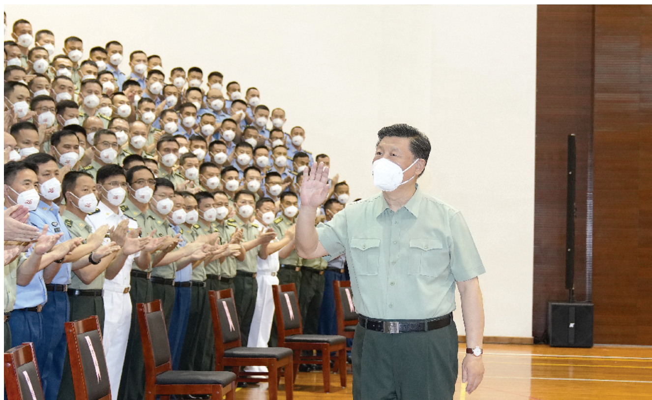
7月1日,中共中央总书记、国家主席、中央军委主席习近平视察了中国人民解放军驻香港部队,代表党中央和中央军委,向驻香港部队全体同志致以诚挚的问候。这是习近平亲切接见驻香港部队官兵代表。