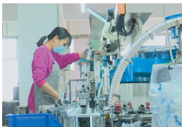
图为安徽天舰文具科技有限公司生产车间

工行淮南分行按照应延尽延的原则，通过续贷、展期为企业纾困解难，共为9户小微企业办理了无还本续贷，涉及金额4150万元。累计为97户小微企业办理延期还本付息149笔，金额15010万元。受疫情影响，安徽天舰文具科技有限公司流动资金告急，已经启动的项目也面临停摆。得知情况后，工行淮南分行迅速行动，开辟绿色通道，克服交通管制、跨区域限制流动等各种阻碍，仅用了不到三天的时间就为企业审批发放贷款400万元，解决了燃眉之急，帮助企业全面复工复产。