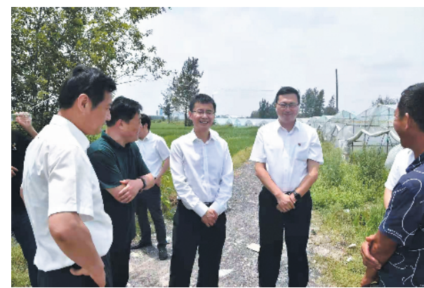
图为赴凤台县调研乡村振兴工作

奋进争先立潮头，实干担当开新局。工行淮南分行秉承国有大行的金融情怀和责任担当，积极投身于助力地方经济稳增长实践，持续加大信贷投放，助力稳经济一揽子政策措施快速落地见效。