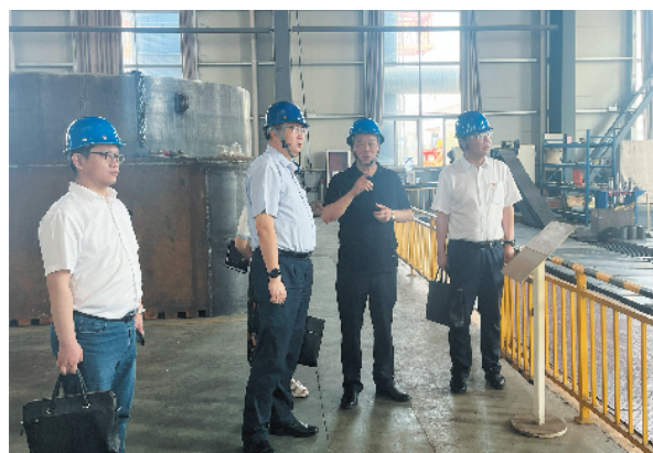
图为实地查看某企业生产厂区

工行淮南分行紧跟市委市政府和监管部门的决策精神，把助力经济发展作为第一要务，引“金融活水”精准浇灌，解实体经济之困。截至5月末，该行全部贷款余额164.3亿，较年初增长10.1亿，其中公司贷款余额站稳百亿关口，较年初净增12.7亿，同业第一；小微企业贷款较年初净增7584万，增幅12.3%，有贷户269户，较同期增加36户，户均余额257万；绿色贷款、战新贷款增速超过100%，实现倍增；科创贷款增速