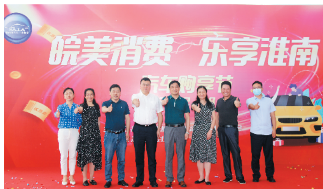
图为参加“皖美消费 乐享淮南”汽车购享节开幕式

截至5月末，工行淮南分行银监普惠口径贷款余额7.4亿，较年初增加10107万，较年初增速15.7%；涉农贷款余额12.4亿，较年初增加1.3亿。