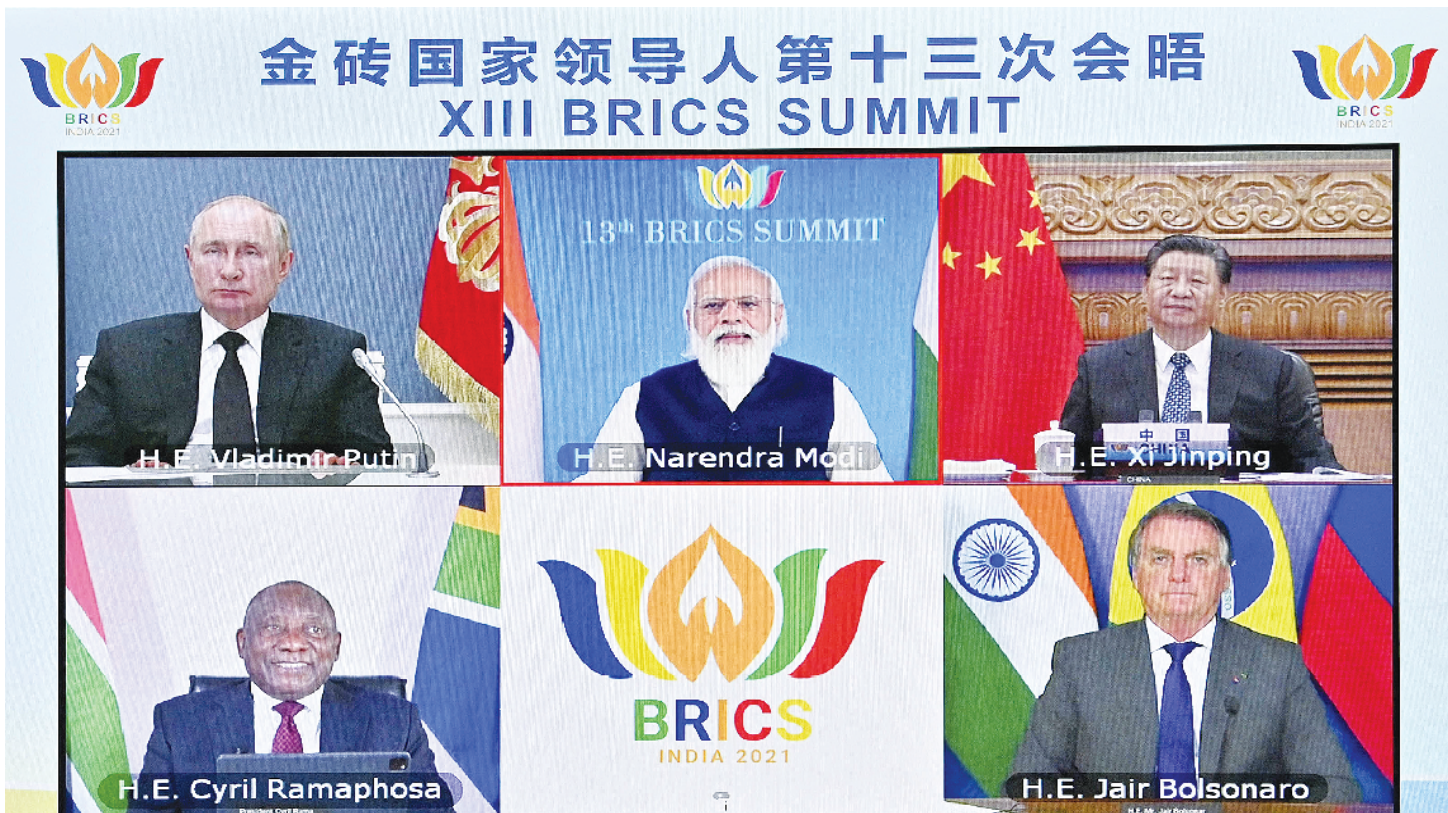
9月9日晚,金砖国家领导人第十三次会晤以视频方式举行。国家主席习近平在北京出席会晤并发表重要讲话。南非总统拉马福萨、巴西总统博索纳罗、俄罗斯总统普京出席,印度总理莫迪主持会议。

新华社北京9月9日电 金砖国家领导人第十三次会晤9日晚以视频方式举行。中国国家主席习近平、南非总统拉马福萨、巴西总统博索纳罗、俄罗斯总统普京出席,印度总理莫迪主持会议。 习近平指出,今年是金砖国家合作15周年。15年来,五国坚持开放包容、平等相待,增进战略沟通和政治互信,尊重彼此社会制度和国情,不断探索正确的国与国相处之道;坚持务实创新、合作共赢,对接发展政策,发挥互补优势,扎实推进各领域务实合作,在共同发展的道路上砥砺前行;坚持公平正义、立己达人,支持多边主义,参与全球治理,成为国际舞台上不可或缺的重要力量。今年以来,五国克服新冠肺炎疫情冲击,推动金砖合作保持发展势头,在很多领域取得了新进展。事实证明,无论遇到什么困难,只要我们心往一处想、劲往一处使,金砖合作就能走稳走实走远。 习近平发表题为《携手金砖合作 应对共同挑战》的重要讲话。 习近平指出,当前,新冠肺炎疫情仍在全球肆虐,世界经济复苏艰难曲折,国际秩序演变深刻复杂。面对挑战,金砖国家要